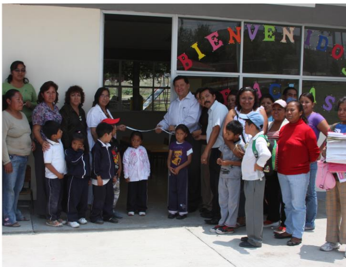
FOTO: Inaugurando Aula de Medios

J) Se hizo la entrega de aulas y malla ciclónica en el Jardín de niños “José Agustín Arrieta” en la Col. Santa Catarina