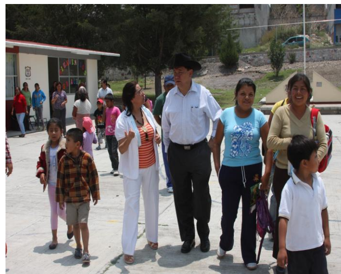
FOTO: Directora y Padres de Familia