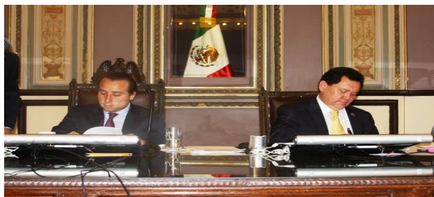
FOTO: Sesión Extraordinaria