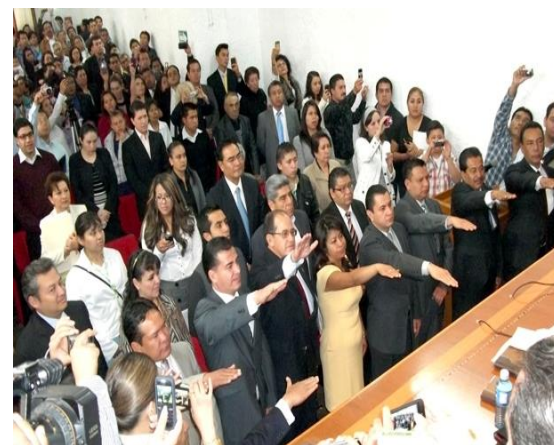
FOTO: Toma de Protesta a Diputados