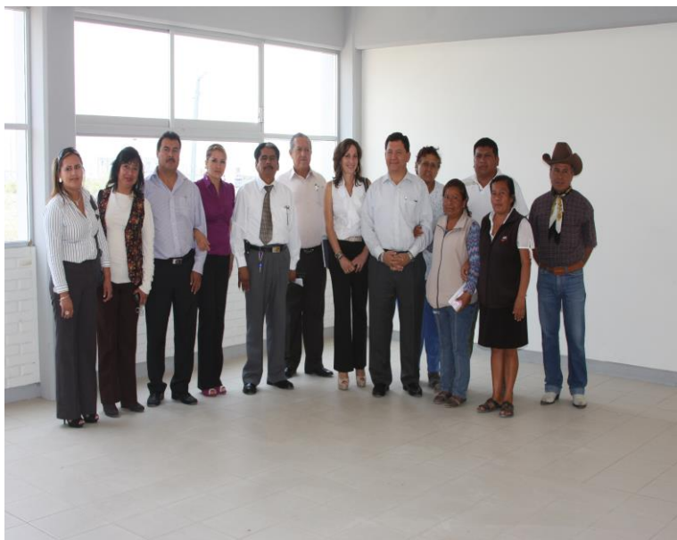
FOTO: Directivos, Padres de Familia y Autoridades