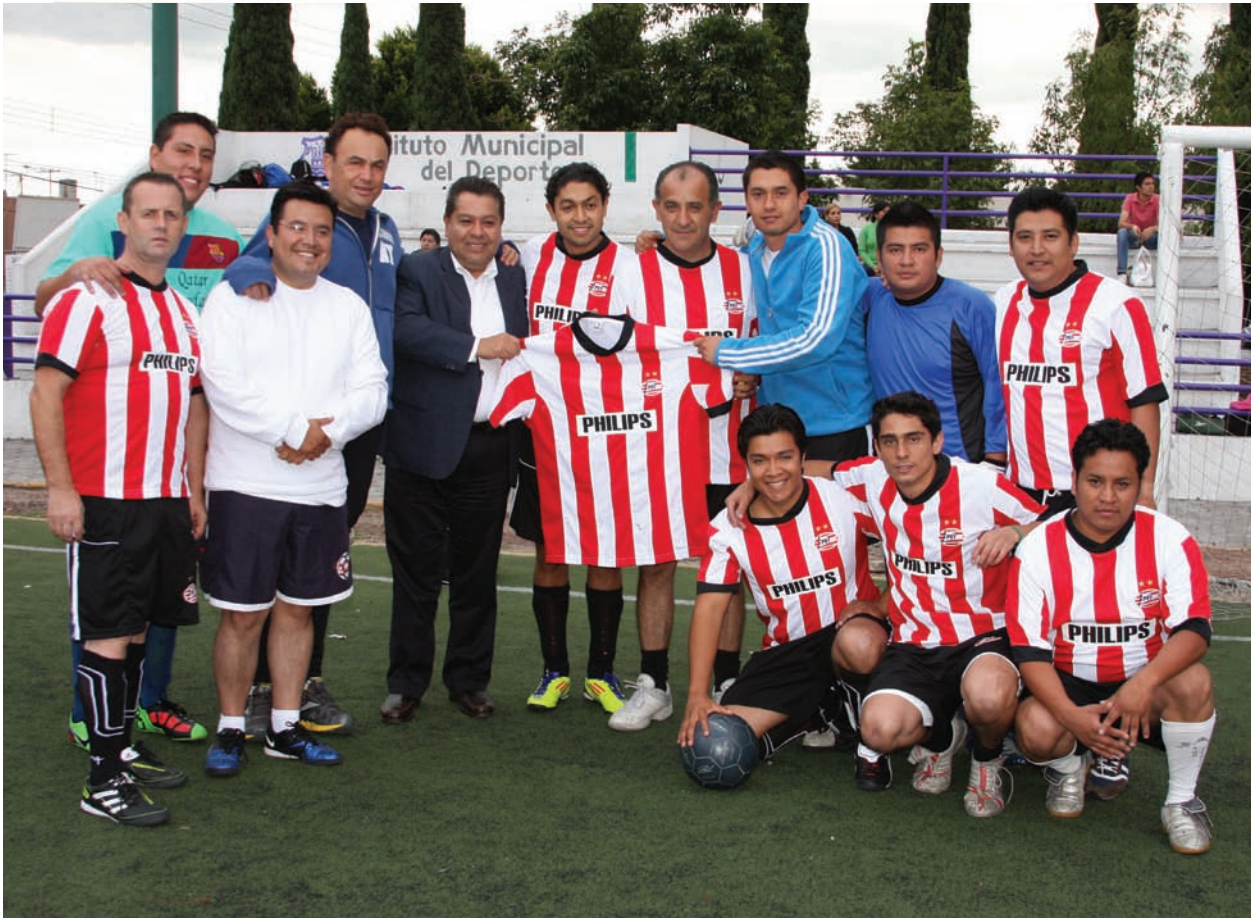
TORNEO DE FUTBOL 7 “DANIEL FORTIS” RAMA VARONIL Y FEMENIL