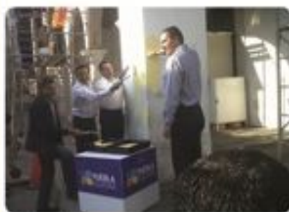
Tetela de Ocampo Inicio de trabajos de imagen urbana