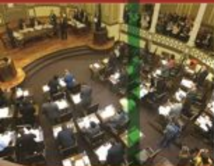
Reunión del Pleno

Informar es un deber de los servidores públicos, e informarse es un derecho de los ciudadanos