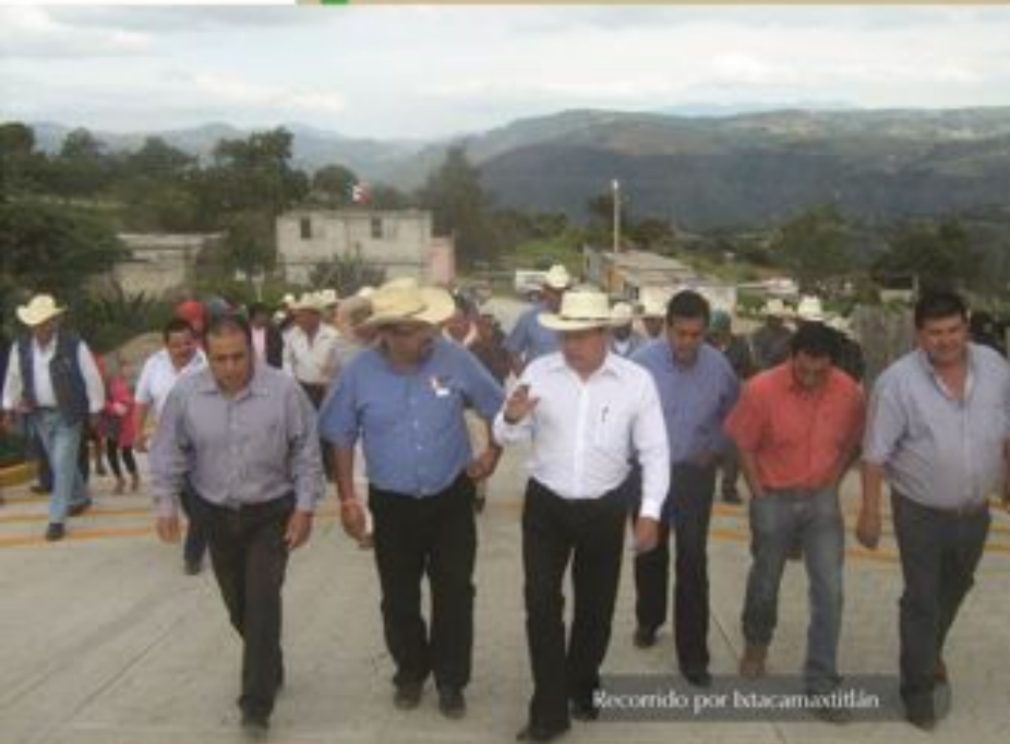
Recorrido por Ixtacamaxtitlán

Con el apoyo del Presidente Municipal de Ixtacamaxtitlán, estamos impulsando la pavimentación del camino de San Alfonso a Santa María Sotoltepec