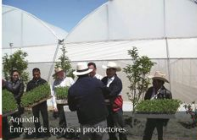
Aquixtla Entrega de apoyos a productores