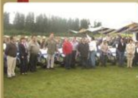
Chignahuapan Entrega de apoyos por cultivos siniestrados