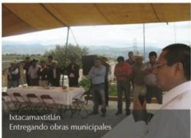
Ixtacamaxitlán Entregando obras municipales