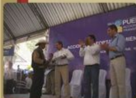
Ixtacamaxtitlán Entrega de fertilizante

Acompañamos al Gobernador del Estado en 8 giras de trabajo para entregar distintos apoyos