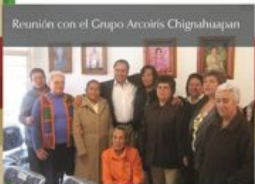
Reunión con el Grupo Arcoiris Chignahuapan