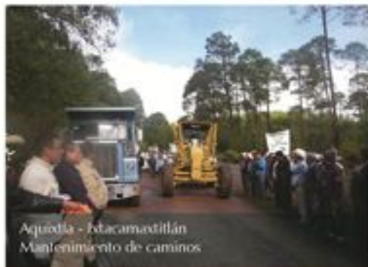
Aquixtla - Ixtacamaxitlán Mantenimiento de caminos

Gracias al apoyo de los presidentes municipales y las comunidades y Aquixtla, Chignahuapan, Ixtacamaxitlán y Tetela de O., se embalastraron más de 30 kilómetros de caminos