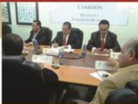
Reunión de Comisión