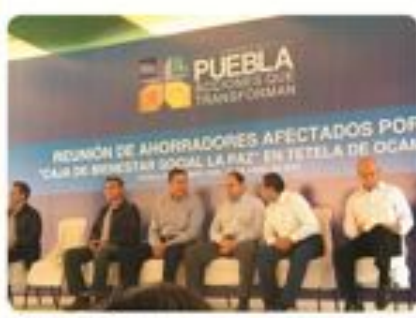
Tetela de Ocampo Entrega de apoyo a defraudados por las "cajas de ahorro"