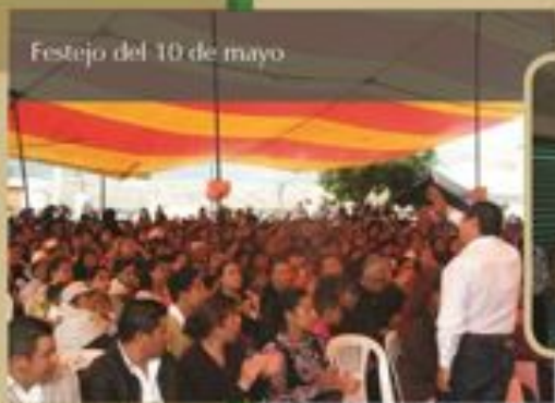
Festejo del 10 de mayo