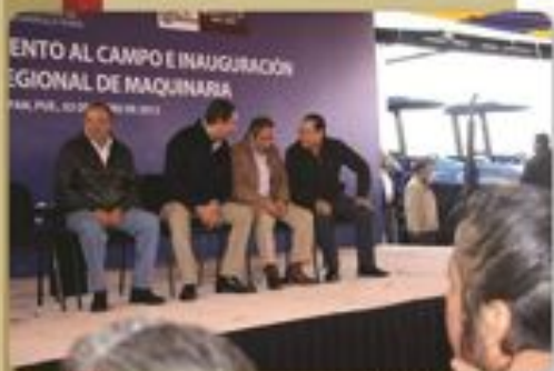
Chignahuapan Central de maquinaria

Acompañamos al Gobernador del Estado en 8 giras de trabajo para entregar distintos apoyos