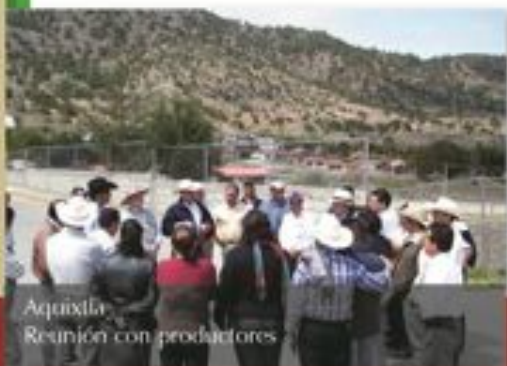
Aquixtla Reunión con productores