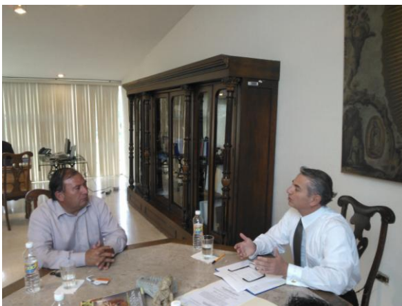
Reunión con Titular del INAH Puebla