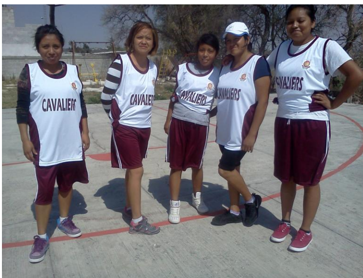
Entrega de Uniformes Deportivos en Diferentes Municipios.