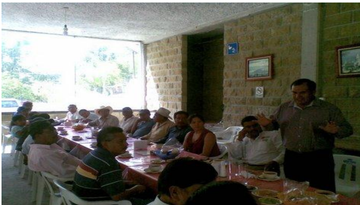
Reuniones con Líderes del Distrito de Tepexi.