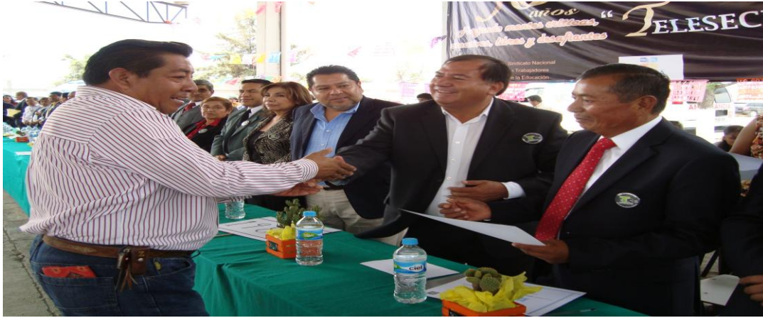
Festival del 30 Aniversario de Telesecundarias