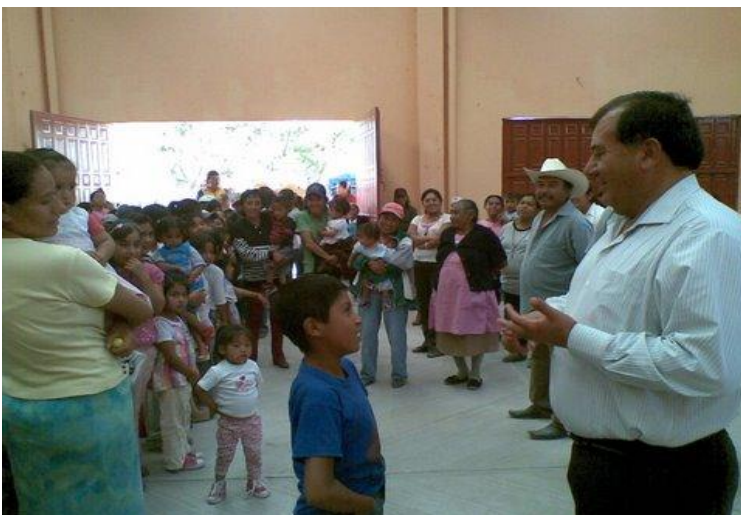
Junta Auxiliar de San Antonio Progreso.