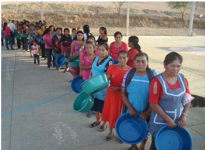
Comunidad de Rancho las Flores.