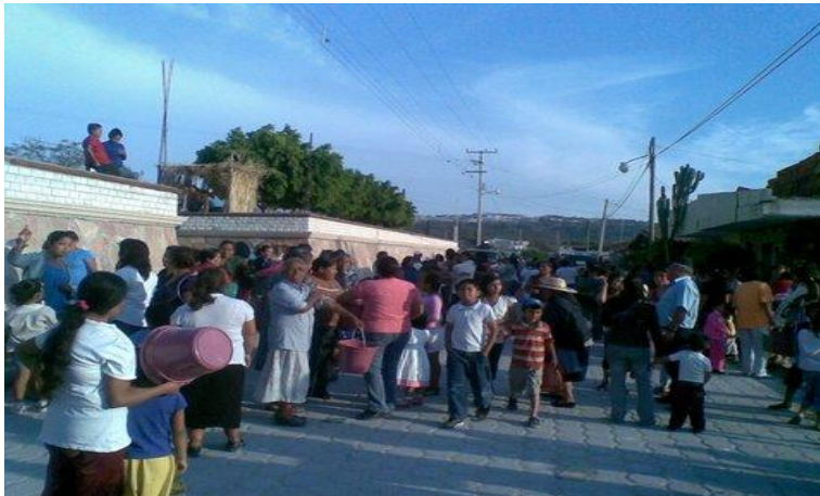
Comunidad de Pie de vaca.