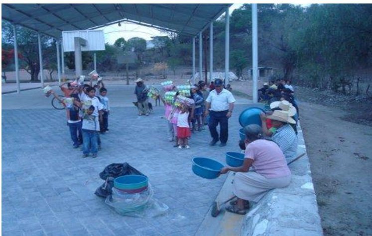
Comunidad de Zacatepec.