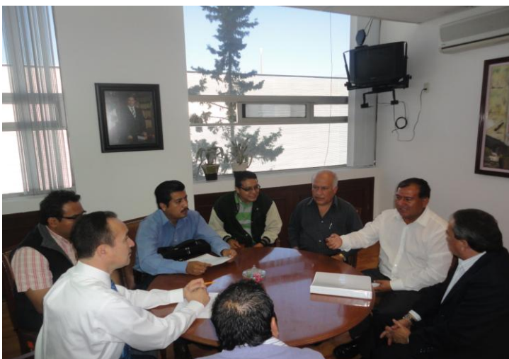
Reunión con Presidentes Municipales y Secretaria de Finanzas.