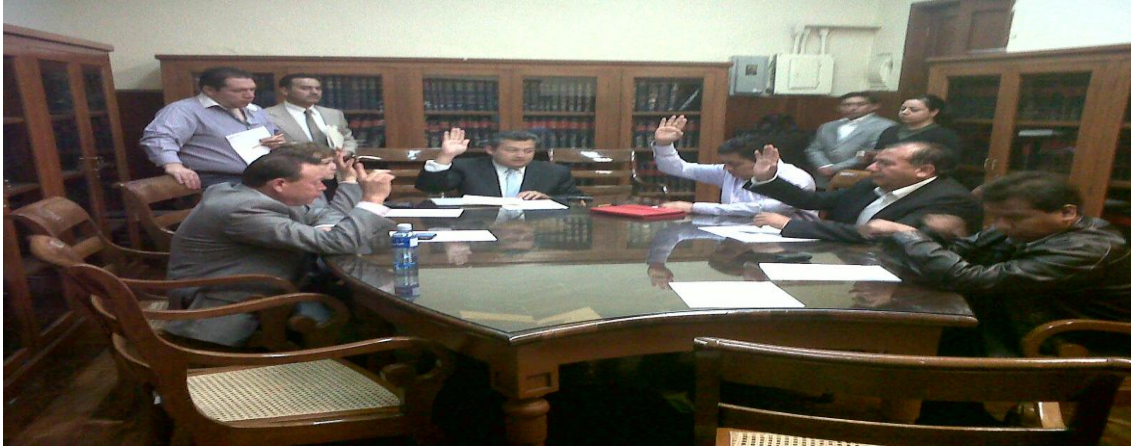
Comisión de Migración y Asuntos Internacionales.