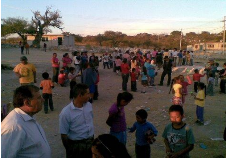
Comunidad de Agua Santa Ana.