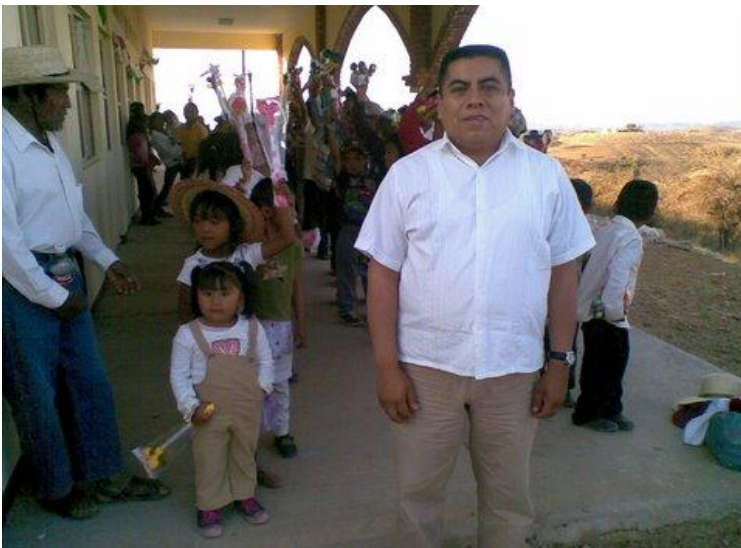
Comunidad de Lomas de San Francisco.