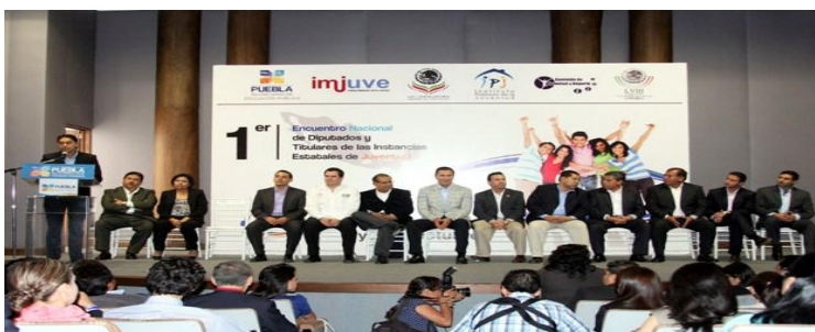
Encuentro Nacional de Diputados.