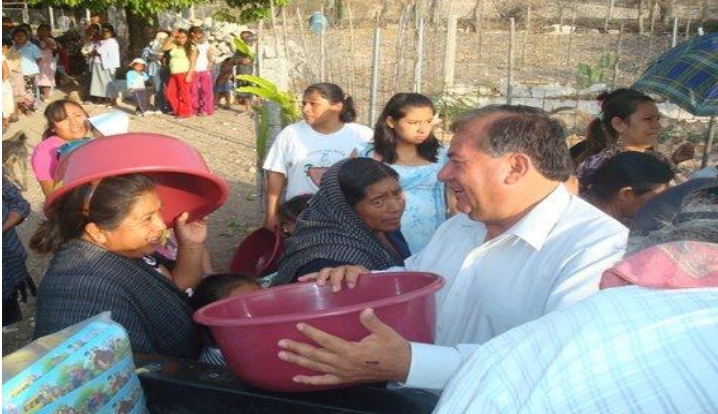
Comunidad de Santo Domingo Chapultepec.