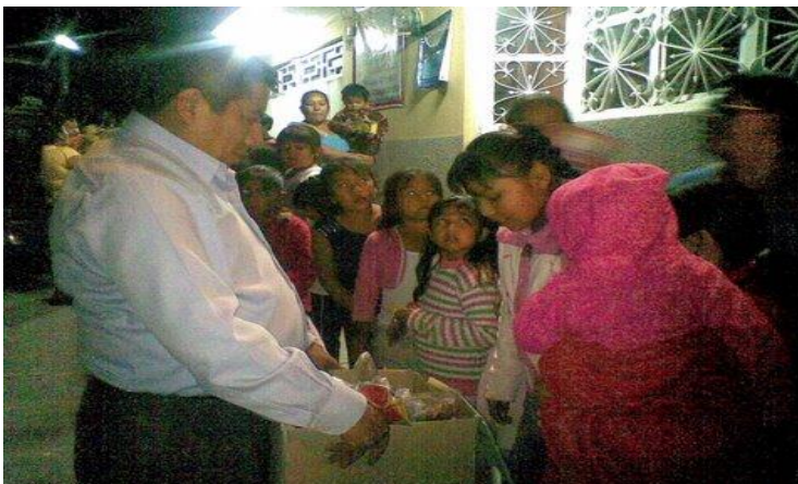
Comunidad del Barrio San Sebastián en Tepexi de Rodríguez.