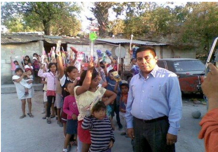
Comunidad de Barrio San Vicente.