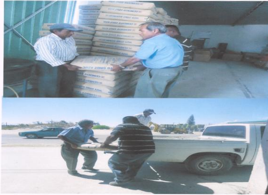
Entrega de Material de Construcción para habitantes de Diferentes Municipios.