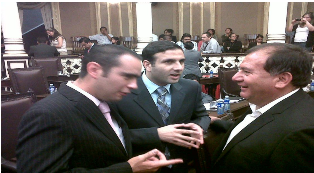
Sesión Pública Ordinaria.