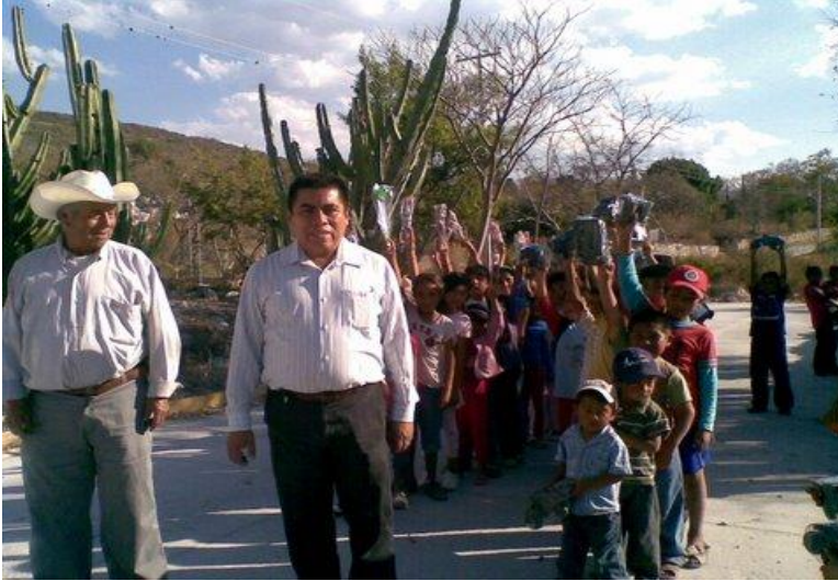
Colonia Agua de la Luna.