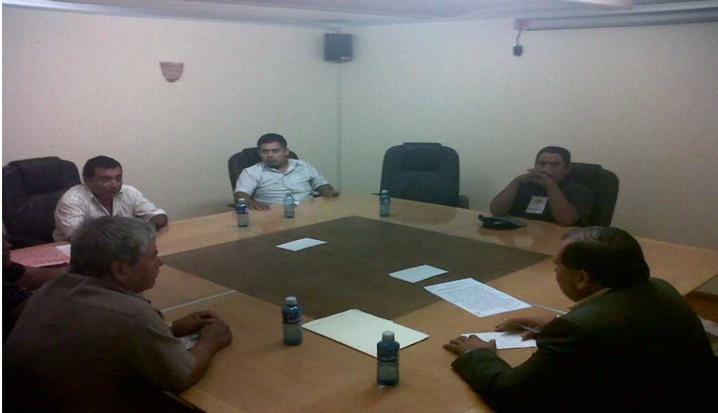
Atención en la Oficina y Salas de Comisiones.