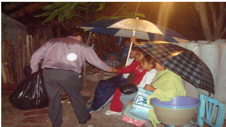
Junta Auxiliar de Almolonga.