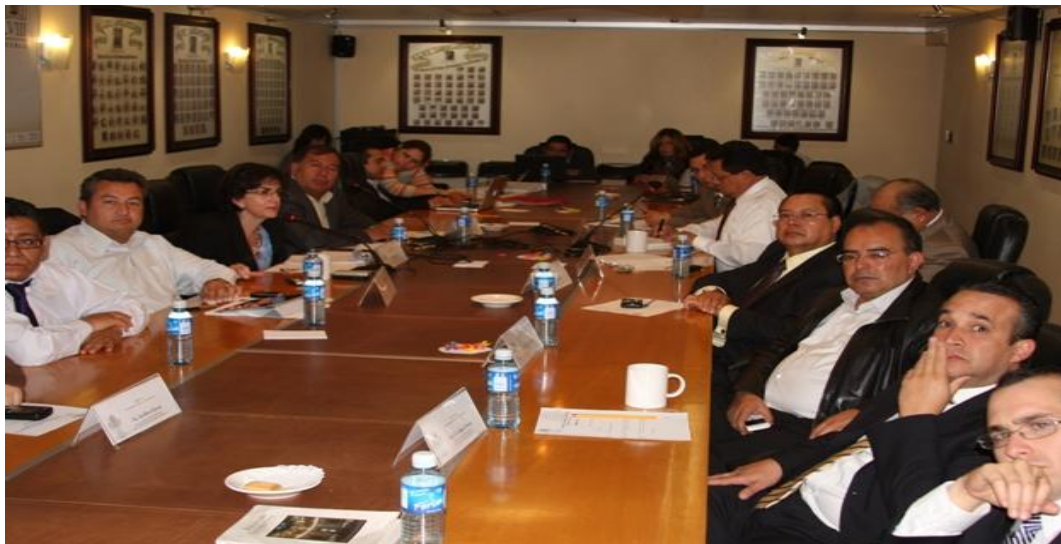
Reunión de comisión de Migración y Asuntos Internacionales