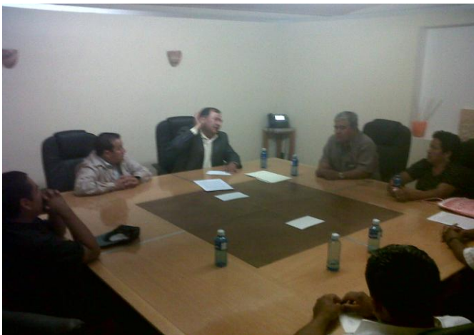
Reuniones con Habitantes del Distrito de Tepexi de Rodríguez.