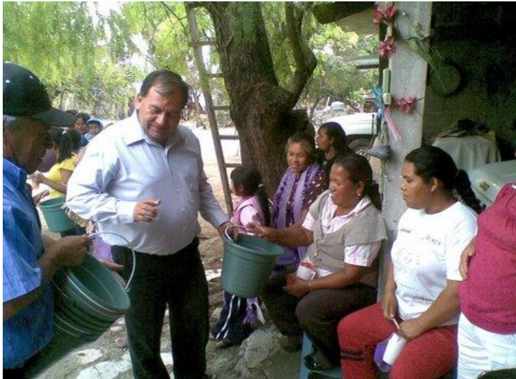
Junta Auxiliar de Huejoyuca.