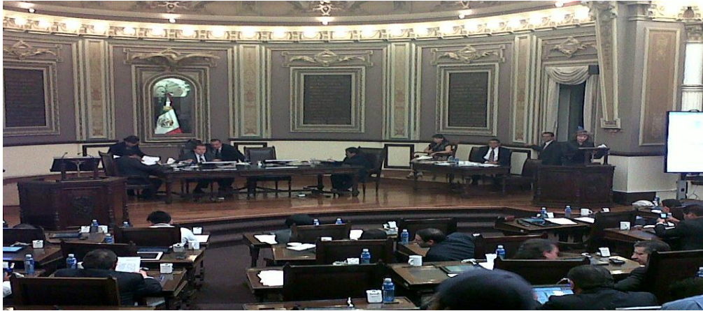
Sesión Pública Extraordinaria