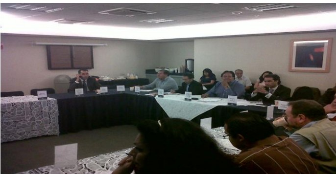
2da Sesión del Subcomité Sectorial del Medio Ambiente y Desarrollo Urbano.