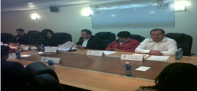
Instalación de la Comisión Especial del 100 Aniversario de la 1ra Restitución Agraria.