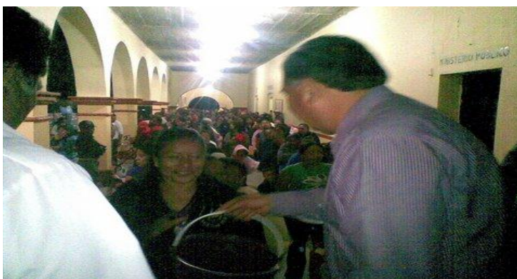
Junta auxiliar de San Felipe Otlaltepec.