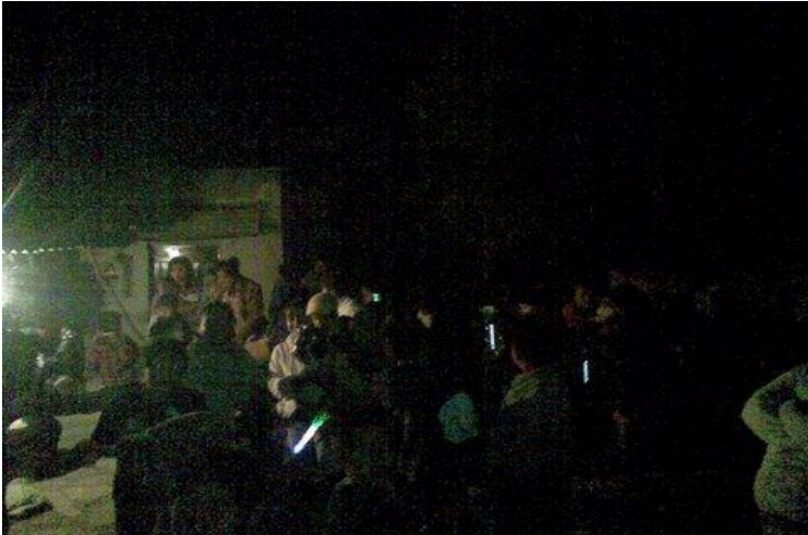
Comunidad de Huejoyuca.