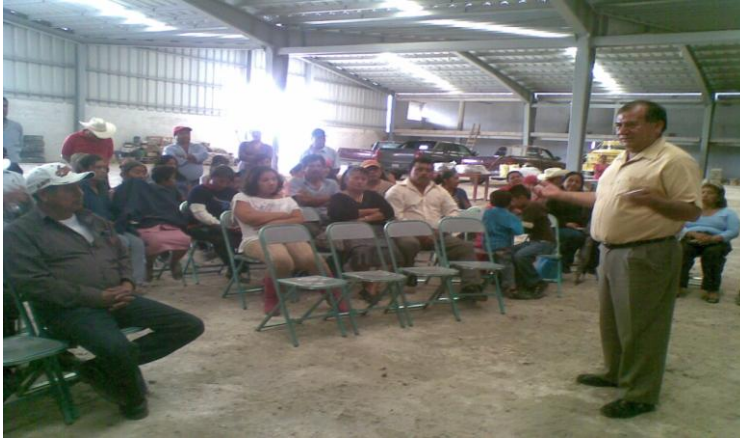
Mesas de trabajo con Lideres del Distrito.