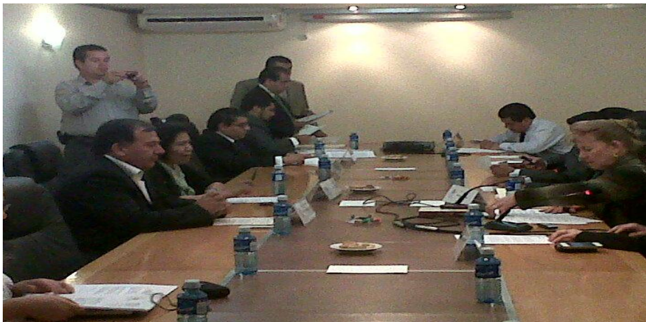
Comisión de Derechos Humanos.