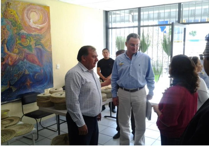
Reunión con Titular de la Secotrade y Artesanos de la Región