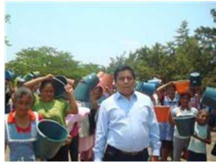
Agua de la Luna