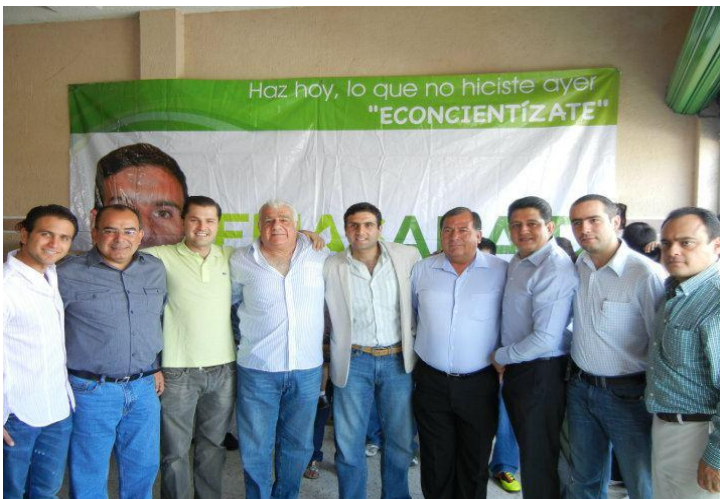
Reunión con Integrantes del PVEM.