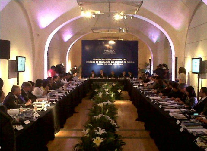
Primera Reunión Ordinaria del Consejo de Educación del Estado de Puebla.