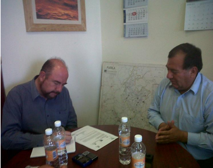
Reuniones con la Secretarias de Sustentabilidad Ambiental y Ordenamiento Territorial