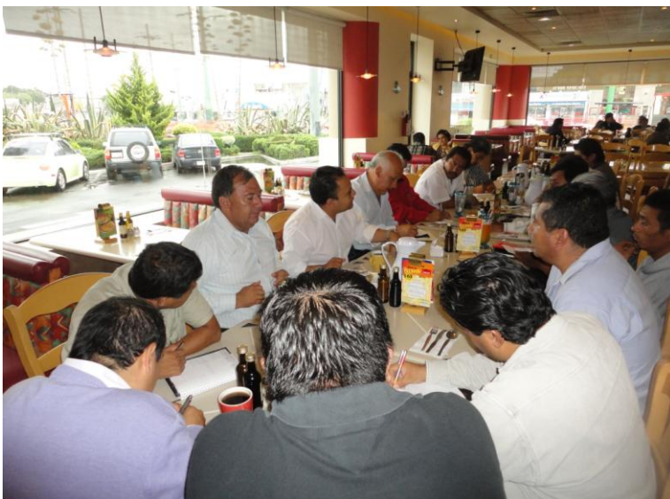
Reuniones con líderes de Organizaciones.