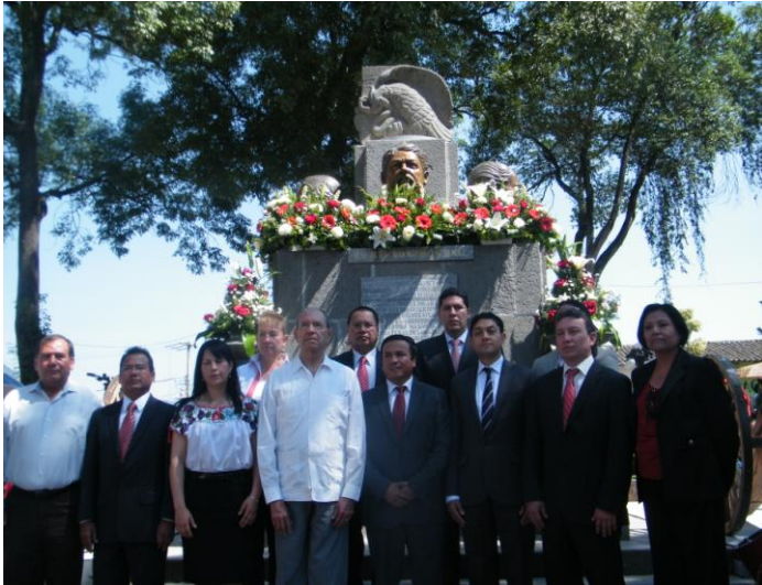
Acto Solemne y Conmemorativo a los Festejos del 5 de Mayo en Tétela de Ocampo.