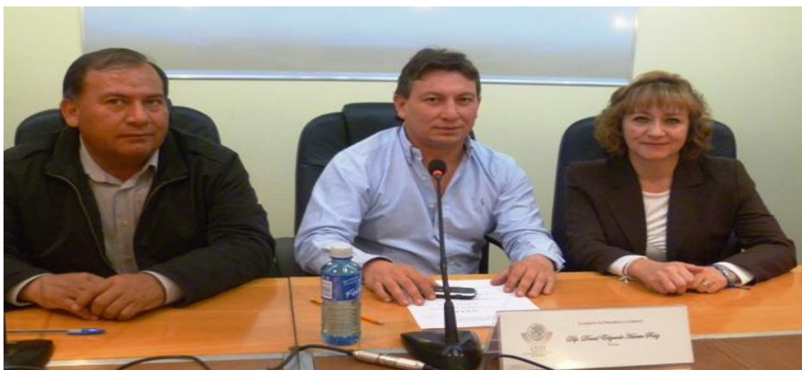
Comisión de Desarrollo Urbano.