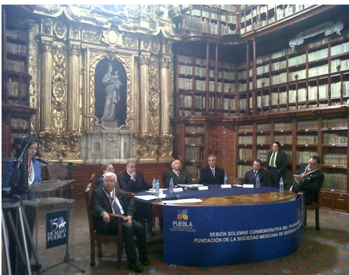
Sesión Solemne Conmemorativo del 179 Aniversario de la Fundación de la Sociedad Mexicana de Geografía.