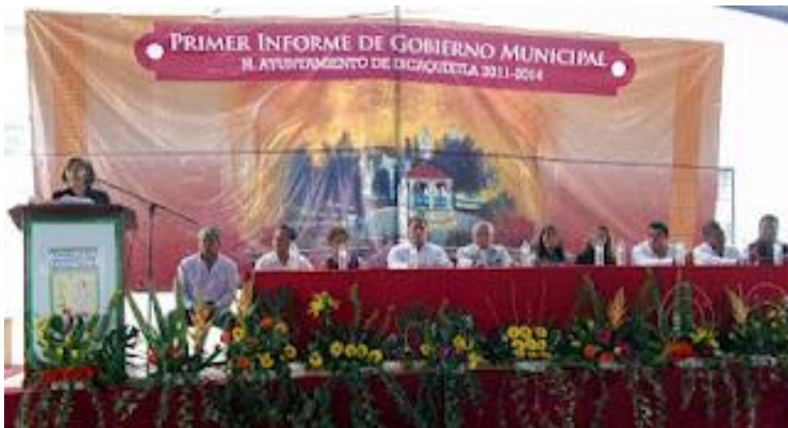
Informes de Actividades de Presidentes Municipales.