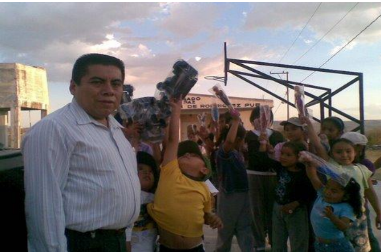
Colonia Buena Vista.