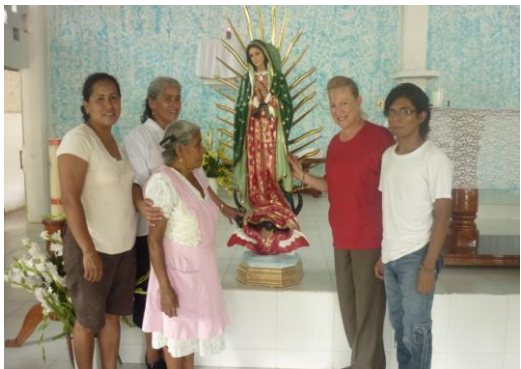
Entrega de la Virgen de Guadalupe a la Capilla de la comunidad “el Tepetate”, perteneciente al municipio de Xicoteppec.