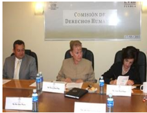
En Comisión de Derechos Humanos se solicitó al Secretario General de Gobierno tomar acciones pertinentes de vigilancia en las diferentes demarcaciones, a fin de que no se registren hechos violentos.