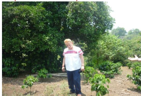
Visita a Fincas en Zihuatehutla, para ver la plantación de arboles ACATROFA que se utilizaran en el proyecto de producción de Biodiesel.