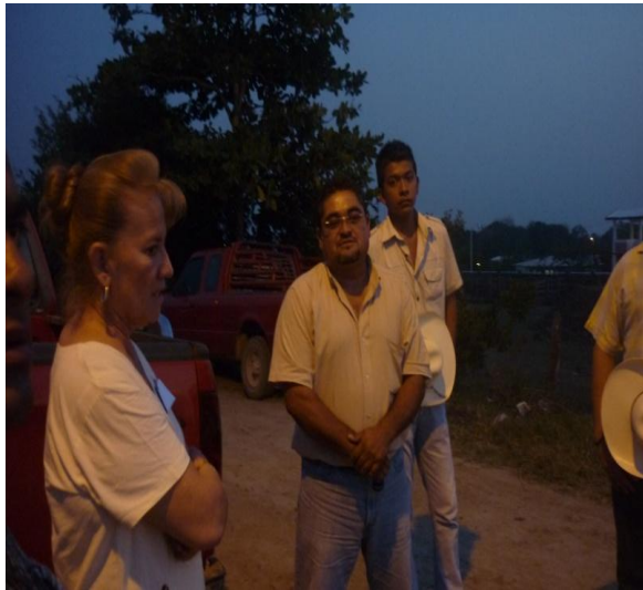
Reunión con la Nueva Asociación de Charros de Francisco Z. Mena.