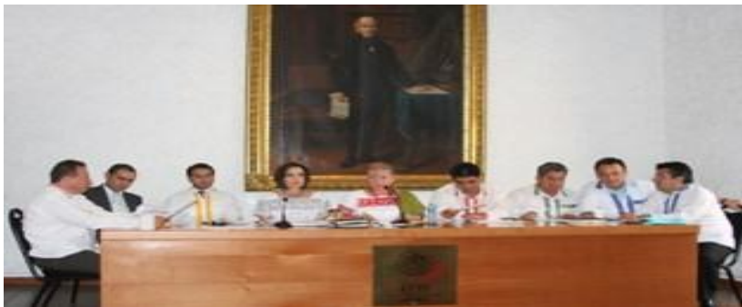
Sesión de la Comisión Permanente y entrega de obsequio a los Diputados integrantes de la Mesa Directiva; camisas y blusas con bordados de Mujeres Indígenas del Municipio de Pantepec