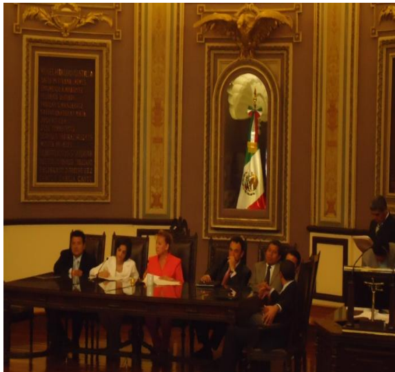
Ultima Sesión de la Comisión Permanente, donde se eligió a la nueva Mesa Directiva que presidirá los trabajos legislativos del Segundo Periodo Ordinario de Sesiones