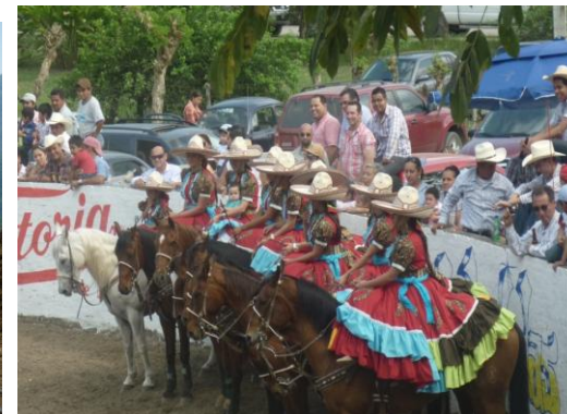
Cabalgata Amelucan - Mecapalapa, Municipio de Pantepec.