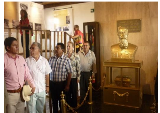
Guardia de Honor en el museo Casa del Gral. Venustiano Carranza en Xicoteppec de Juárez