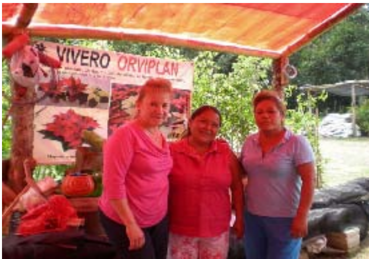
Entrega de apoyo económico para la compra de Malla Sombra para el Vivero ORVIPLAN, de la Comunidad La Morena del Municipio de Venustiano Carranza