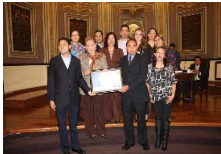
Entrega al Presidente de la Junta de Gobierno y Coordinación Política, el Certificado que avala al Congreso del Estado, como Institución comprometida con la igualdad de oportunidades y el respeto a la equidad de género

SEGUNDO INFORME DE ACTIVIDADES LEGISLATIVAS