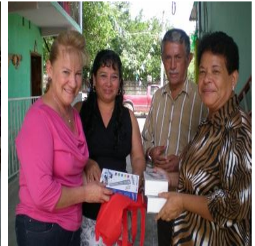
Entrega de Cemento, Micrófonos y Cobijas a la Parroquia de Venustiano Carranza