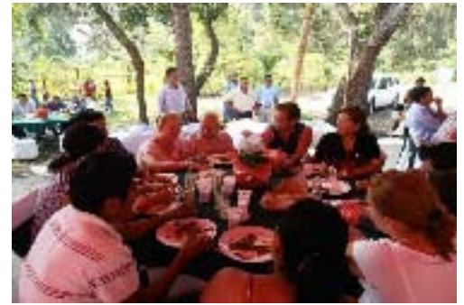
Comida con motivo del Día del Maestro, en el Municipio de Francisco Z. Mena