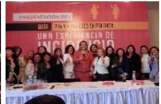
Presentación de la " Guía 2% y más Mujeres en la Política", este evento se realizó en colaboración con el National Democratic Institute, el H. Congreso del Estado, el Instituto Electoral del Estado y el Instituto Poblano de las Mujeres