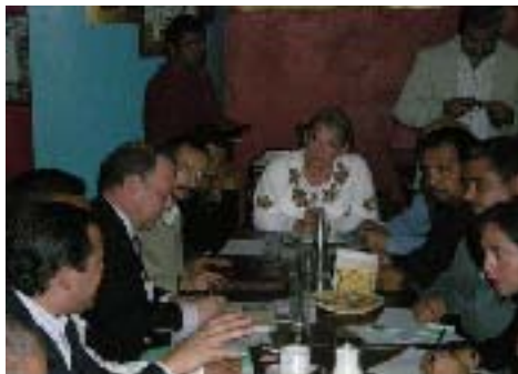
Reunión de Trabajo con el Secretario de Turismo y Presidentes Municipales de los Distritos 25° y 26°