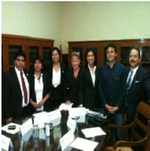
Comisión Especial de la Familia