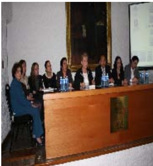
Presentación del Nuevo Comité del MEG ante trabajadores y colaboradores del H. Congreso del Estado de Puebla