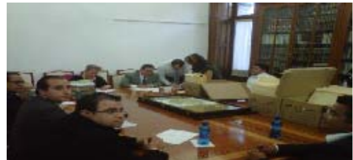
Evaluación de los expedientes de los aspirantes a Magistrados del TEEP

SEGUNDO INFORME DE ACTIVIDADES LEGISLATIVAS