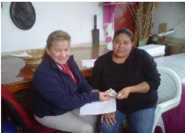
Apoyo económico para la Comparza del Carnaval de Xicotepéc