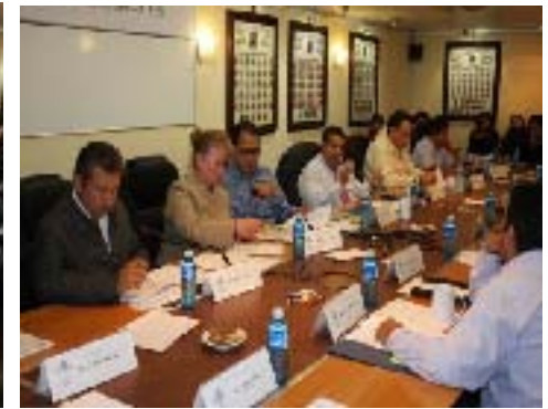
Instalación y Reunión de Trabajo de la Comisión Especial Electoral , misma que tuvo el honor de presidir y que tuvo como objetivo, coordinar el Proceso de Elección de los Nuevos Consejeros Electorales del Instituto Estatal Electoral