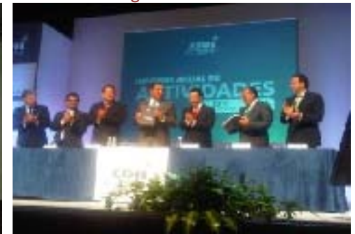
Primer Informe de Actividades del Presidente de la Comisión de Derechos Humanos del Estado