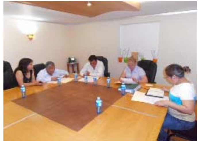
Entrega-Recepción de la Comisión de Derechos Humanos