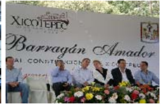
1er Informe de Gobierno de Carlos Barragán Amador, Pdte. Municipal de Xicotepéc