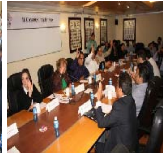
Votación en el Pleno para la elección de los 9 Consejeros Electorales y Toma de Protesta de los mismos