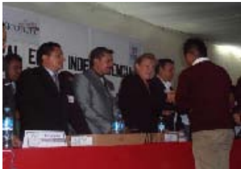
Ceremonia de Graduación Bachillerato ESMAD Independencia, Xicotepec.