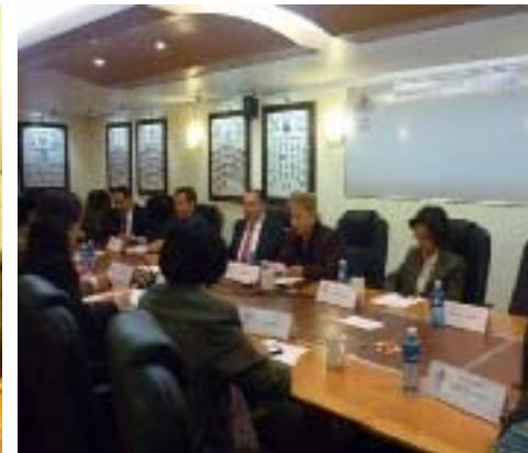
Visita del Alto Comisionado en la ONU de Derechos Humanos al Congreso del Estado