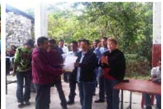
Entrega de la CLAVE a los Tele Bachilleratos del Ejido Benito Juárez y a la comunidad de Techalotla en el Municipio de Jalpan.