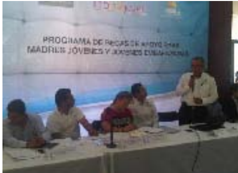
Reunión de trabajo para dar a conocer el Programa de Becas PROMAJOVEN, dirigido a madres jóvenes y jóvenes embarazadas