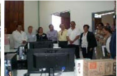
Entrega de la Clave de la Universidad del Desarrollo, Campus Francisco Z. Mena, Puebla