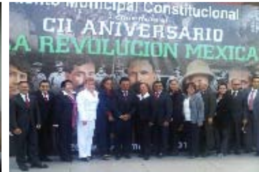
Desfile conmemorativo del 20 de Noviembre