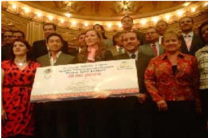
Donativo para el programa Beca un niño Indígena