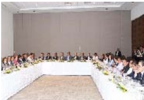
Presentación de la Agenda Legislativa en Casa Puebla