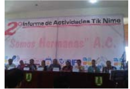
Asistencia al 2º Informe de Actividades de la Asociación Tik Nime