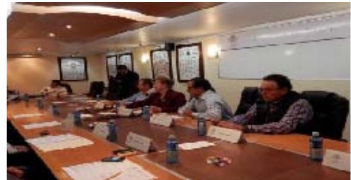
Reunión de la Comisión Especial para la elección de Magistrados del TEEP y Rueda de Prensa