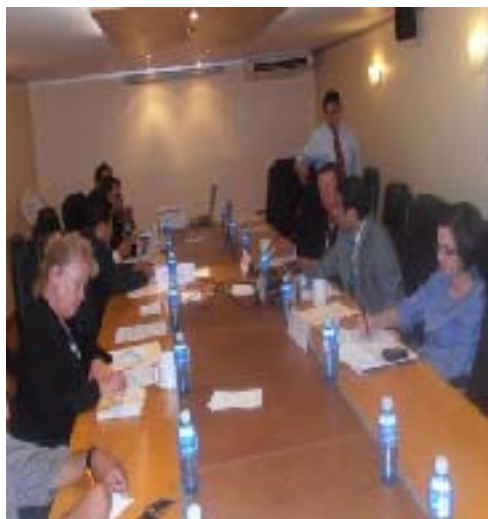
Comisión de Medio Ambiente