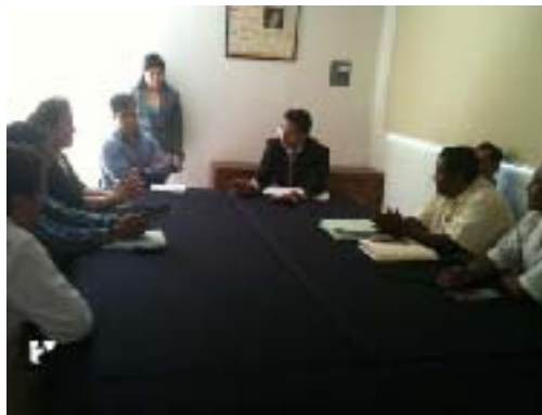
Reunión de Trabajo con el Enlace Municipal de la SEP, Jueces y Comités de Padres de Familia del Municipio de Jalpan, para la gestión de tres CLAVES de Bachilleratos Digitales