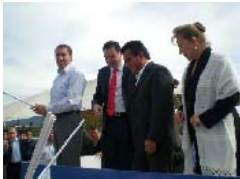
Banderazo en el Inicio de obra del Boulevard Benito Juárez en Xicotepéc