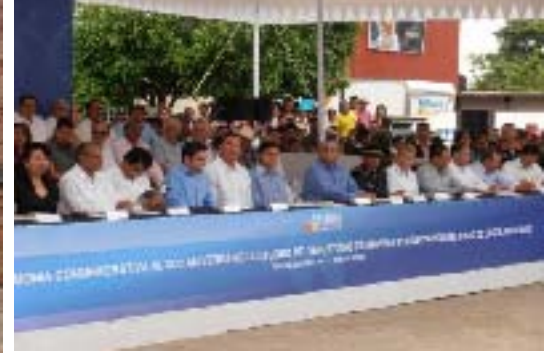
Ceremonia Conmemorativa del XCII Aniversario Luctuoso del Gral. Venustiano Carranza en Tlaxcalantongo, Xicotepec