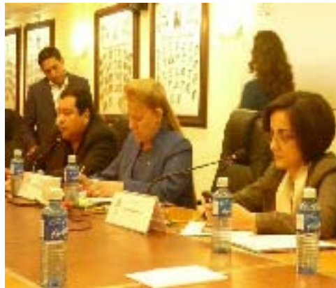
Reunión de la Comisión de Derechos Humanos

Dr. Rafael Moreno Valle Rosas, Gobernador Constitucional del Estado de Puebla