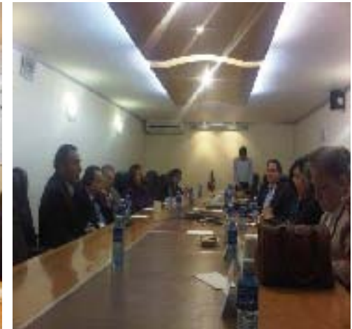
Reunión de Trabajo con los Jueces de lo Familiar y la Comisión de la Familia