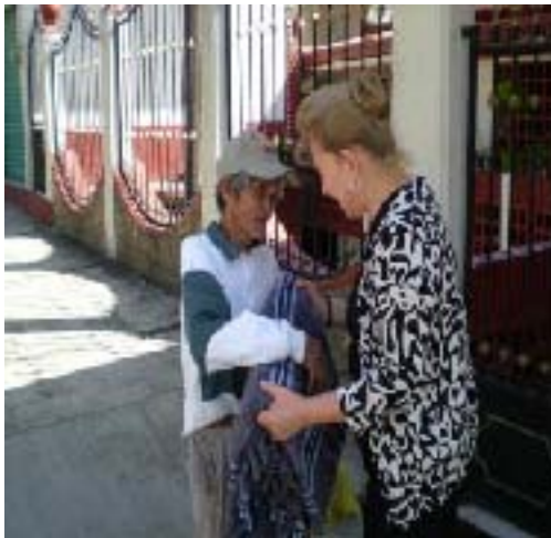
Apoyo con entrega de cobijas a personas de escasos recursos del Distrito de Xicotepec