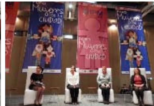
Asistencia al Foro "Mujeres por la Ciudad" encabezado por el Instituto Poblano de las Mujeres