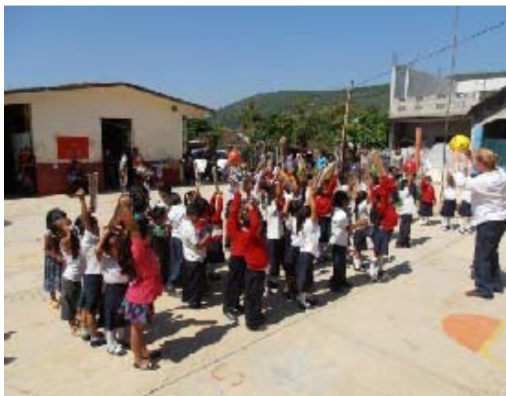
Entrega de Juguetes a los Niños del Preescolar Indígena TUTUNAKUJ, en la Junta Auxiliar de Papaloctipan, Tlacuilopec.