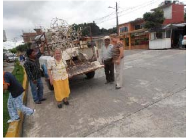
Donación de tres Toritos para las Fiestas Patronales de Itzatlán, Tlacuilopec