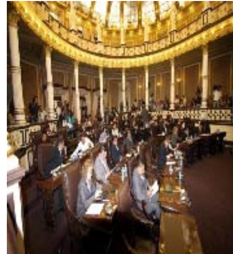
Sesiones Públicas Ordinarias