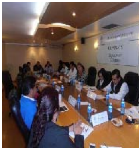
Primera Reunión de la Comisión de Equidad y Género a cargo de una servidora