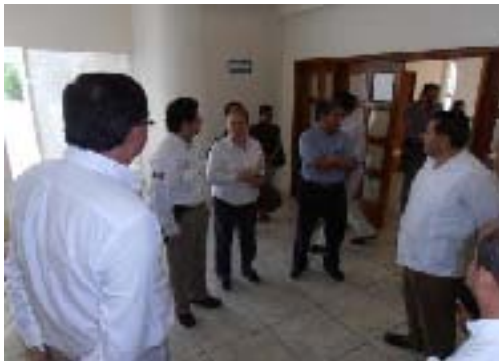
Visita a las Instalaciones de PEMEX en Poza Rica y a los Pozos de Explotación de Crudo del Paleocanal en Chicontepec