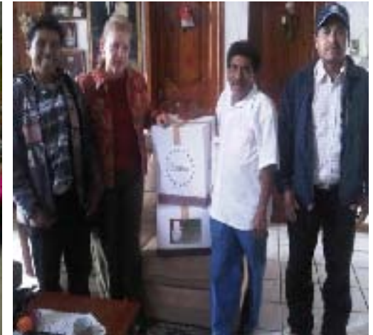
Entrega de lámparas a la comunidad de Nactanca Grande, Xicotepec