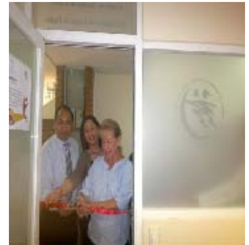
Inauguración de la Oficina del Comité del MEG en el H. Congreso del Estado