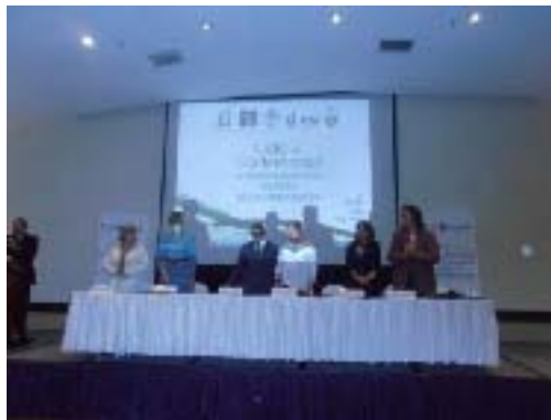
Asistencia a la Conferencia "Transversalización un Reto de la Democracia" impartido por el Tribunal Electoral del Poder Judicial de la Federación