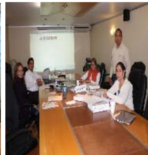
Reuniones de Trabajo con el Comité del Modelo de Equidad de Género