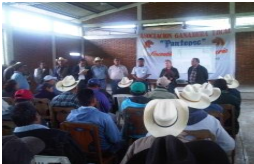
Reunión con Productores Cítricos de los Municipios de Venustiano Carranza, Z. Mena y Pantepec