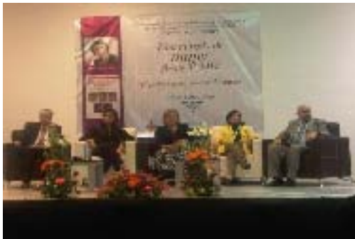
Presentación del libro "Mirada de Mujer frente al 2012"