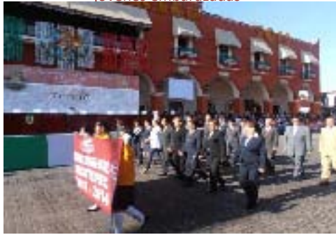
Desfile Conmemorativo del 16 de Septiembre