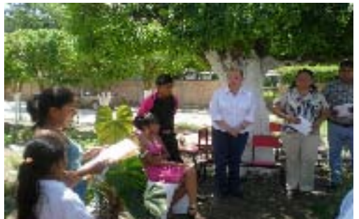
Asistencia al Concurso de Jardines, de la Escuela Primaria de la Junta