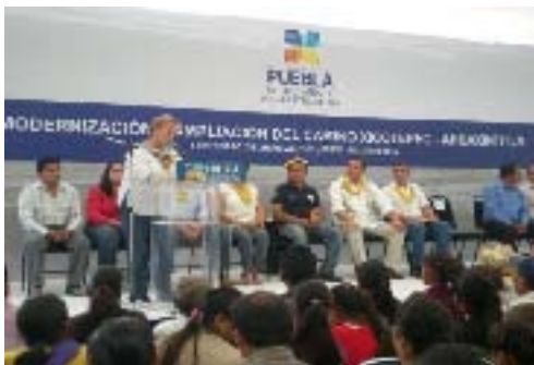
Modernización y Ampliación del camino Xicotepec-Ahuaxintitla