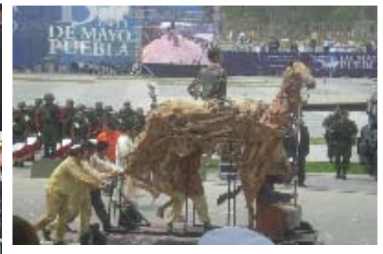
Festejos del 150 Aniversario de la Batalla Heroica del 5 de mayo