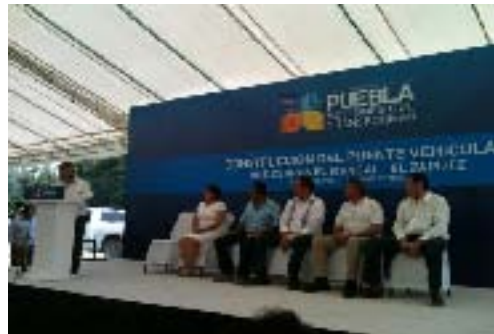
Construcción del Puente Dos Cerros el Mangal-El Zapote