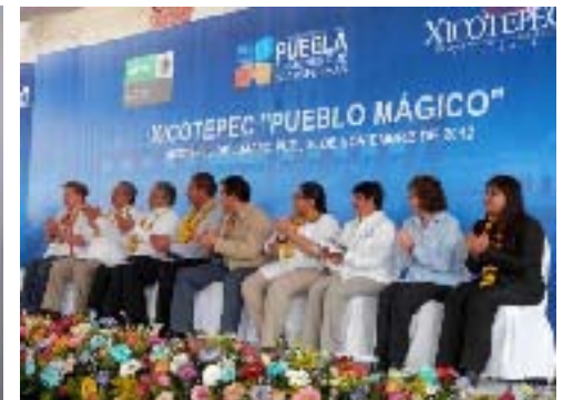
Entrega del nombramiento de Pueblo Mágico a Xicotepec de Juárez