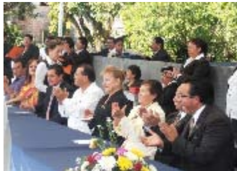
Ceremonia de Clausura Esc. Sec. Gral. Ignacio Zaragoza