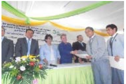
Ceremonia de Clausura COBAEP Plantel 11 Xicotepec