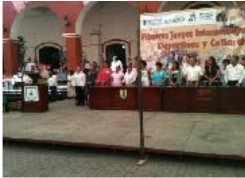
Juegos Intermunicipales Deportivos y Culturales para Adultos Mayores