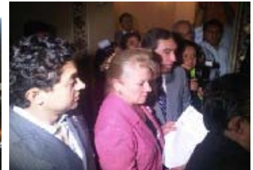
Publicación de Lista de los Aspirantes a Consejeros Electorales