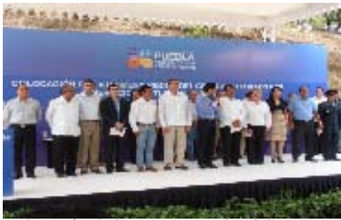
Colocación de la Primera Piedra del Centro Integrador y de Servicios en la Junta Auxiliar de Tlaxcalantongo, Xicotepec

LXVIII LEGISLATURA DE LOS CONGRESOS DEL ESTADO DE PUEBLA