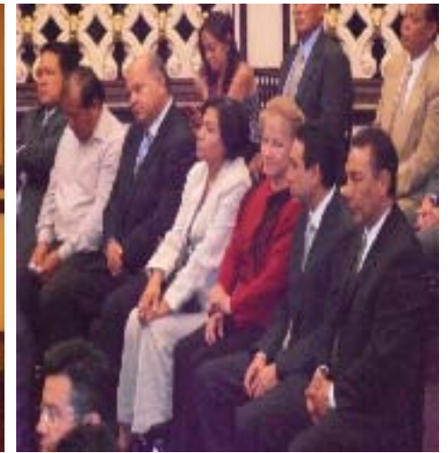
Homenaje a Don Gilberto Bosques Saldivar, distinguido Embajador y Diplomático Mexicano; orgullosamente Mixteco.