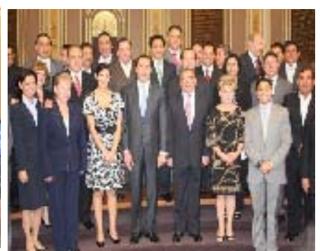
Firma de Convenio y Colaboración en el Marco de los Festejos de los 150 años de la Batalla del 5 de Mayo