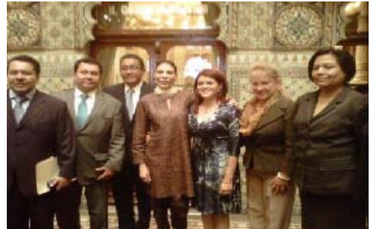
Donativo para la creación del refugio para victima de trata de personas