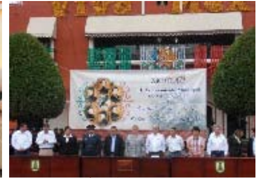
Ceremonia Cívica de la Gesta Heroica de los Niños Héroes de Chapultepec