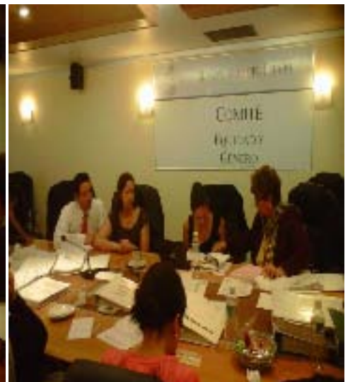
Auditoria para obtener la Recertificación del Modelo MEG:2003 por parte del Instituto Nacional de las Mujeres

SEGUNDO INFORME DE ACTIVIDADES LEGISLATIVAS