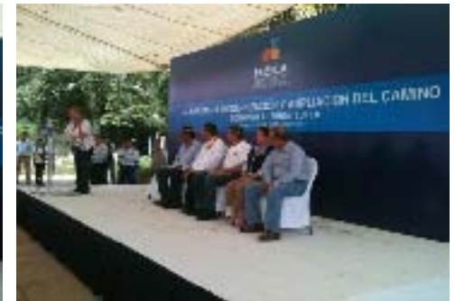
Modernización y Ampliación del Camino Ocomantla-Zihuateutla