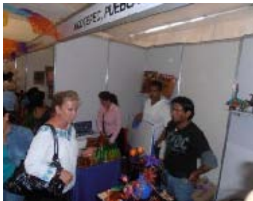
Evento Conmemorativo del Día Internacional de los Pueblos Indígenas, celebrado en la Ciudad de Puebla