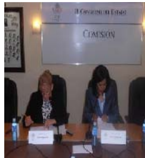
Comisión Especial de la Familia

SEGUNDO INFORME DE ACTIVIDADES LEGISLATIVAS