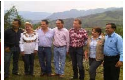
Gira de Trabajo con Srío. de Turismo al Municipio de Tlacuilotepec