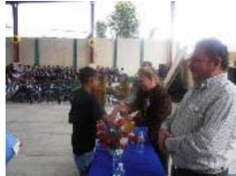
Participación en el Aniversario de la Esc. Secundaria Club Rotario de Xicotepec