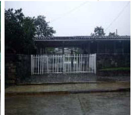
Gestione con CAPCEE impermeabilizante para toda la Escuela Sec. Gral. Ignacio Zaragoza, así como pintura y cuatro juegos de baño.