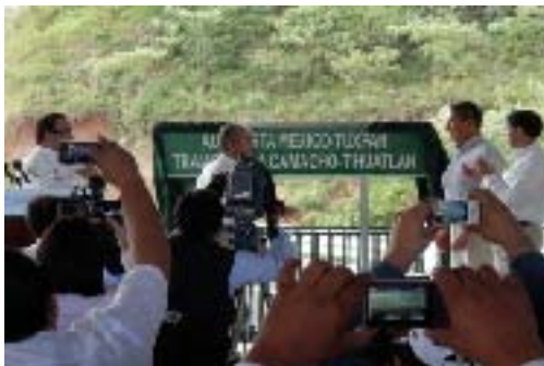
Inauguración del Tamo 2 de la Autopista México-Tuxpan