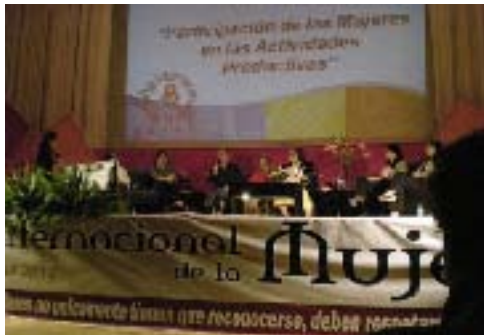
Festejo de día Internacional de la Mujer con el DIF Municipal de Xicotepec y la Universidad Tecnológica de Xicotepec Juárez