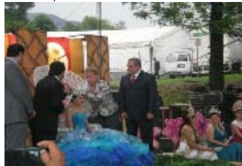
Inauguración de la Expo Feria Xicotepec 2012