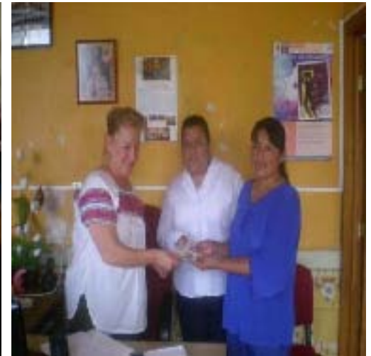
Entrega de Cobijas y Apoyo Económico a personas de diversas comunidades del Distrito 26.