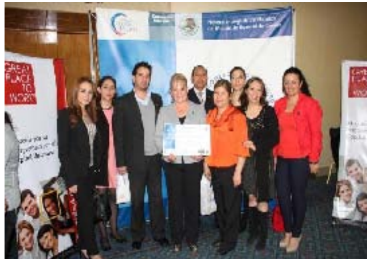
Entrega del Certificado del Modelo de Equidad de Género MEG:2003 al H. Congreso del Estado de Puebla