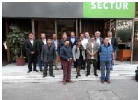
Visita del Comité de Turismo a SECTUR para el nombramiento de Xicotepec de Juárez como Pueblo Mágico