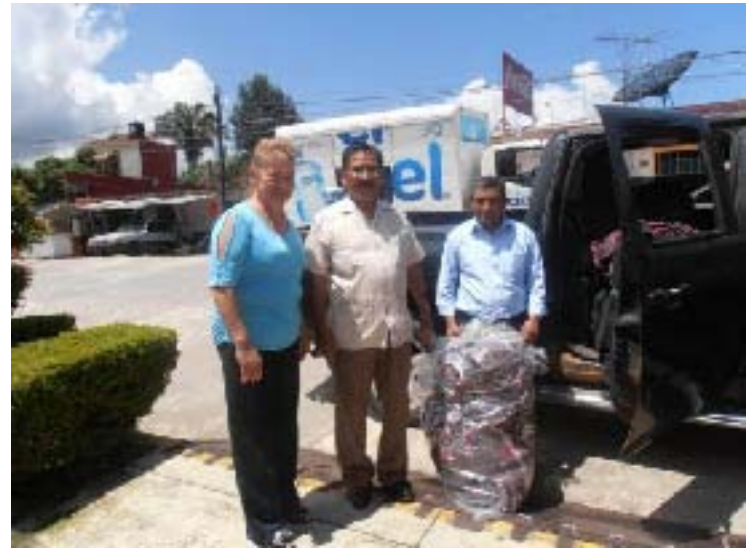
Entrega de Cobijas al Presidente Municipal de Jalpan