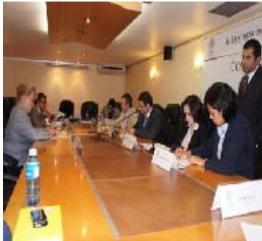
Reunión de Trabajo con la Comisión de Medio Ambiente