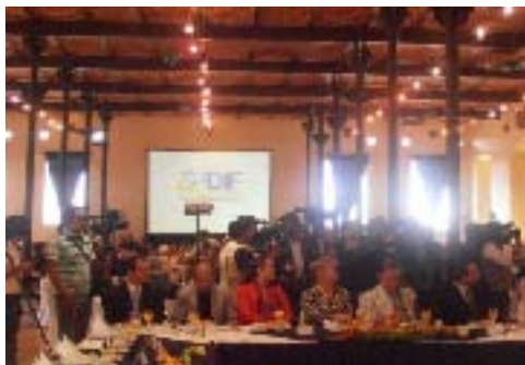
Presentación del Programa Desarrollo Integral de las Personas con Discapacidad, por parte del Sistema Estatal DIF y la SECOTRADE