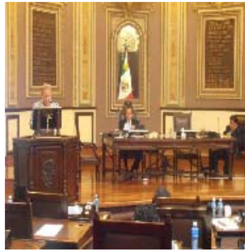
Punto de Acuerdo en donde se exhorta a todos los municipios del estado a contar con una biblioteca pública