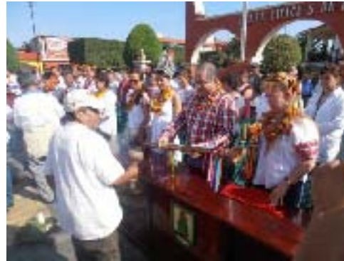
Celebración de las Fiestas de Juan Techachalco, en la Xochipila, Xicotepec de Juárez