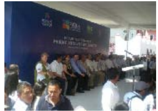
Entrega del Nombramiento de "Pueblo Mágico" a Pahuatlan