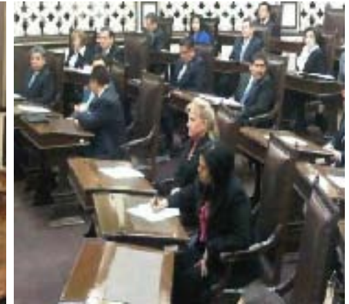
1er Informe de Actividades

Dr. Rafael Moreno Valle Rosas, Gobernador Constitucional del Estado de Puebla