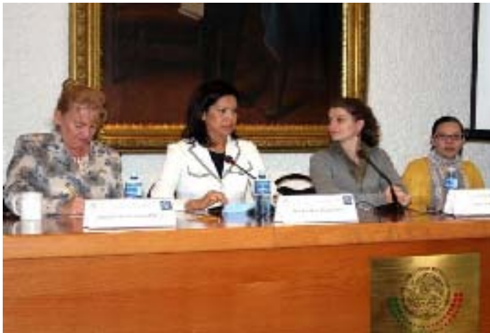
Taller sobre la Legislación en materia de Trata de Personas en México