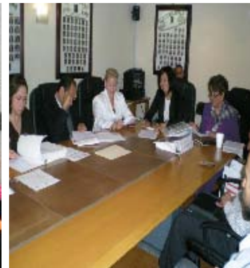
Entrega-Recepción de Carpetas del Comité del MEG