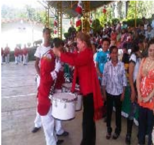
Entrega de Banda de Guerra en Telesecundaria de la Cabecera municipal de Tlacuilotepec