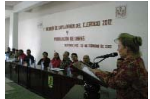
Reunión de la Coplademun en Xicotepéc