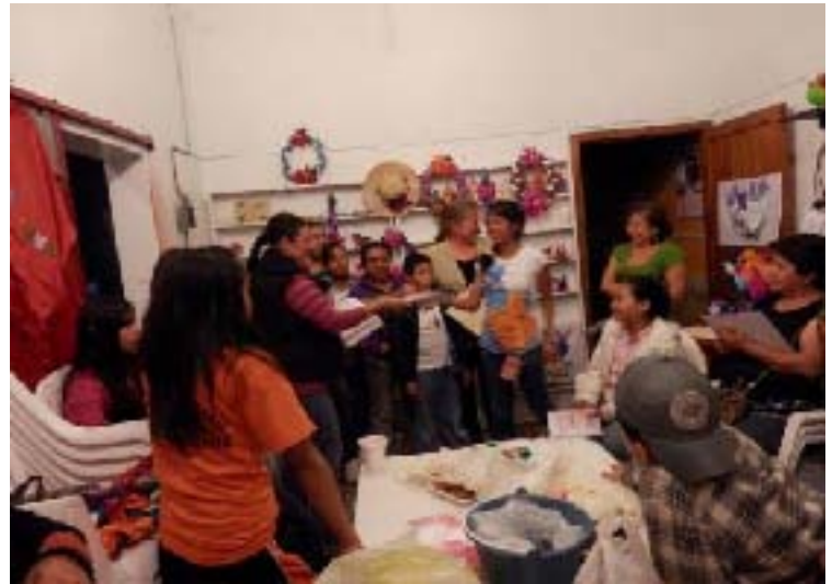
En la casa de Gestión se impartió el Curso de Papel de China a través de la técnica Paché, el cual fue cursado principalmente por mujeres y niños en la cabecera distrital de Xicotepec de Juárez