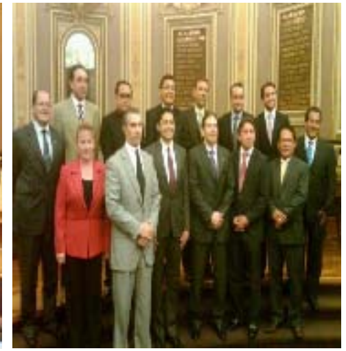
Firma del convenio de colaboración con la Escuela Libre de Derecho de Puebla