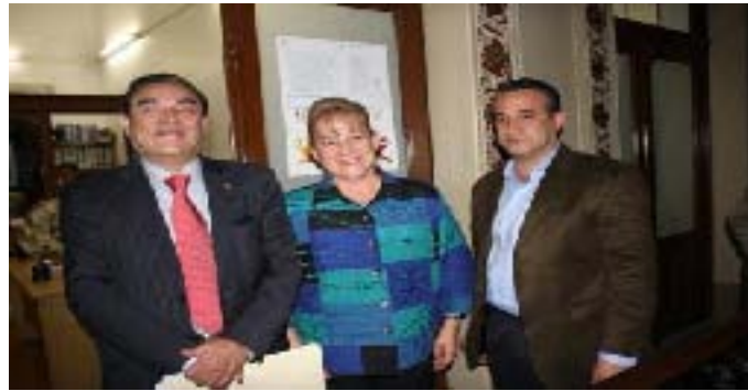
Cierre de la Convocatoria para los aspirantes a Magistrados y publicación de su registro