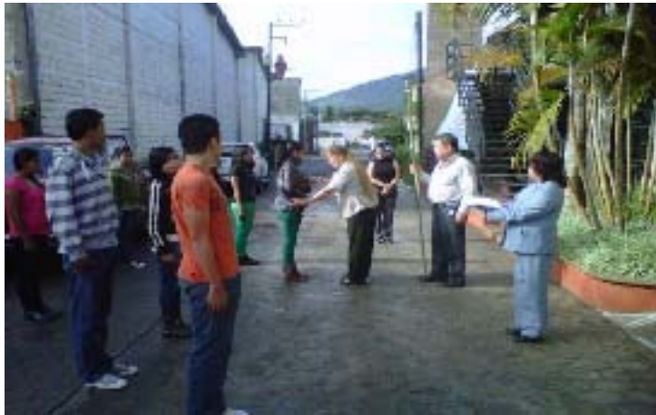
Entrega de Bandera a CECYTE de Xicotepéc