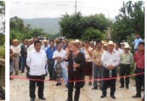
Inauguración de obras con el Presidente Municipal de Jalpan, Nicolás Galindo Pérez