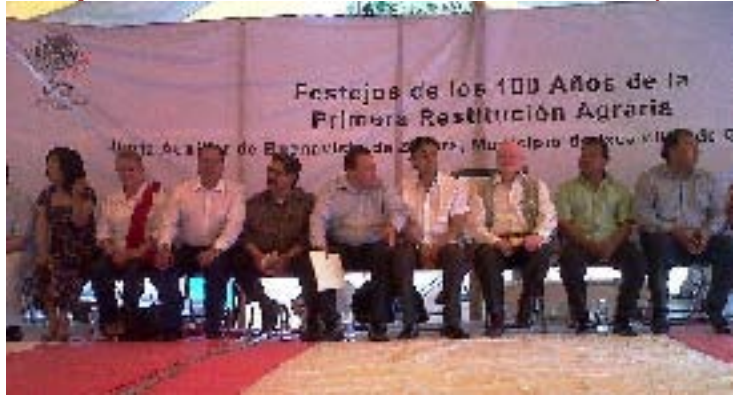
Festejos de los 100 años de la Primera Restitución Agraria, celebrada en el Municipio de Ixcamilpa de Guerrero