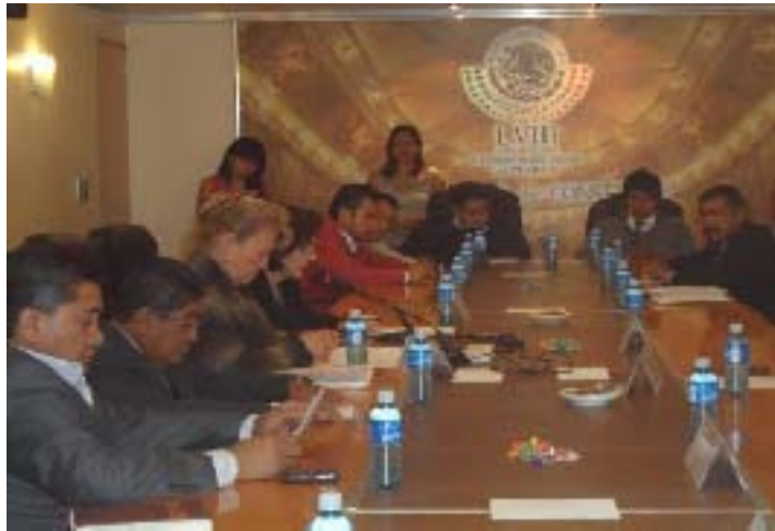
Reunión de la Comisión de Derechos Humanos