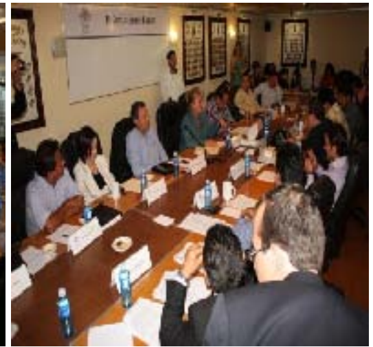
Reunión de la Comisión Especial Electoral, donde se eligieron a los 36 perfiles para ocupar el cargo de Consejeros Electorales del Estado