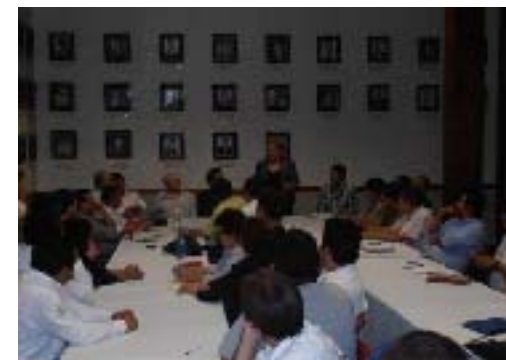
Reunión de Trabajo para la obtención del Certificación y Nombramiento de Xicotepec, como "Pueblo Mágico"