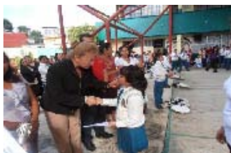
Clausura de la Esc. Primaria Club Rotario Los Tezontles