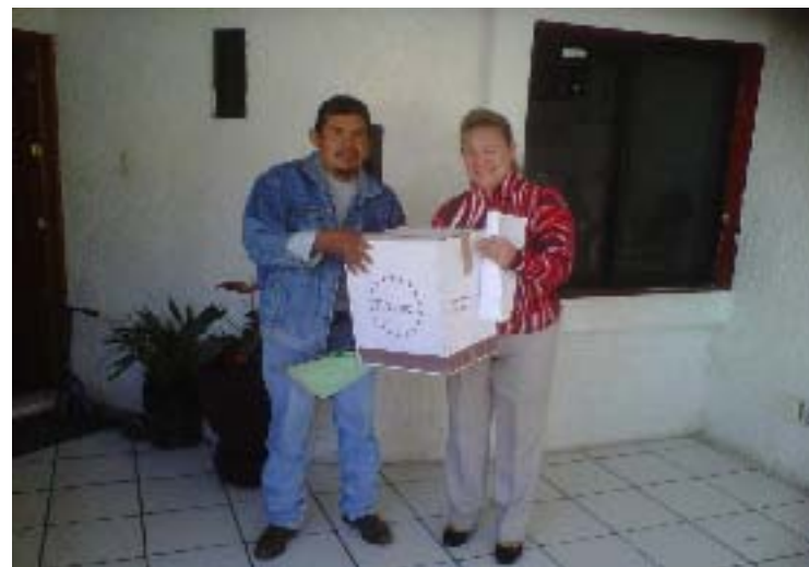
Donación de una tonelada de cemento y una lámpara para la Iglesia del Zacatal, Tlacuilotepec