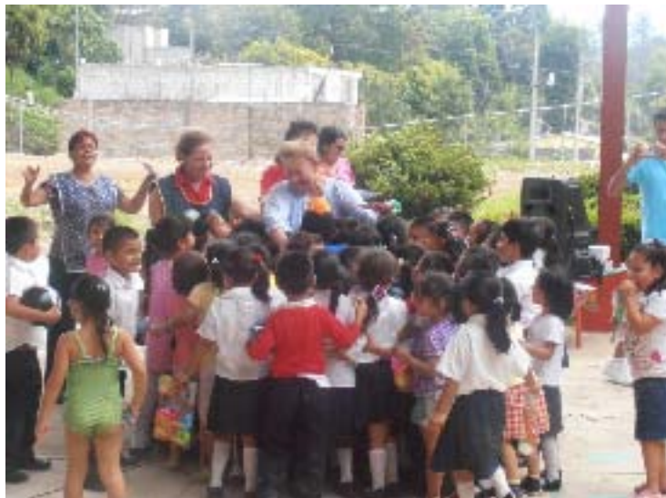
Entrega de Juguetes en el Jardín de Niños Francisco González Bocanegra, en la Junta Auxiliar de San Isidro, Xicotepec

LXVIII LEGISLATURA DE LOS CONGRESOS DEL ESTADO DE PUEBLA