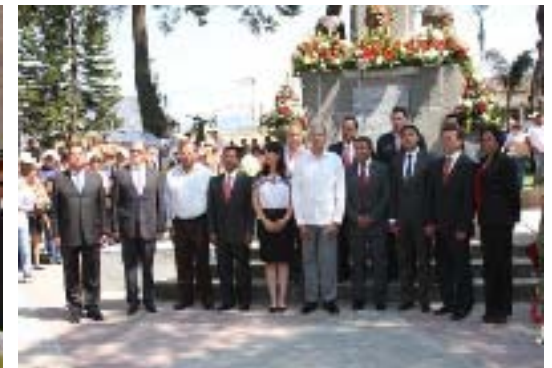
Ceremonia Cívica y Conmemorativa del 5 de Mayo en el Municipio de Tetela de Ocampo