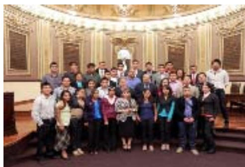
Diputado por un día, Visita de los Alumnos de Derecho de la UNIDES, Xicotepec