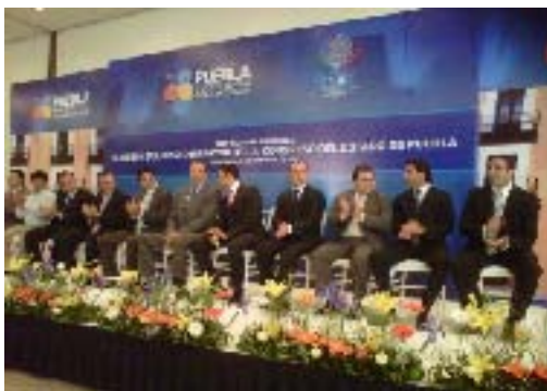
Entrega del Mesón del Cristo al H. Congreso del Estado como nuevo edificio del Poder Legislativo