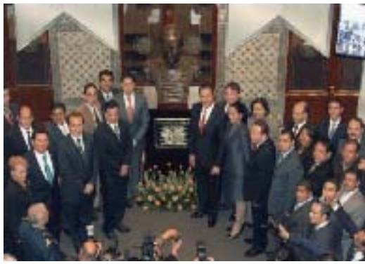
Develación del busto del Gral. Ignacio Zaragoza en el Patio del H. Congreso del Estado