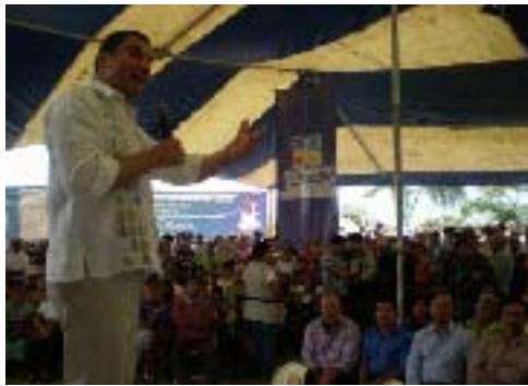
Inicio de Obra carretera Tlaxco-Papalotipan