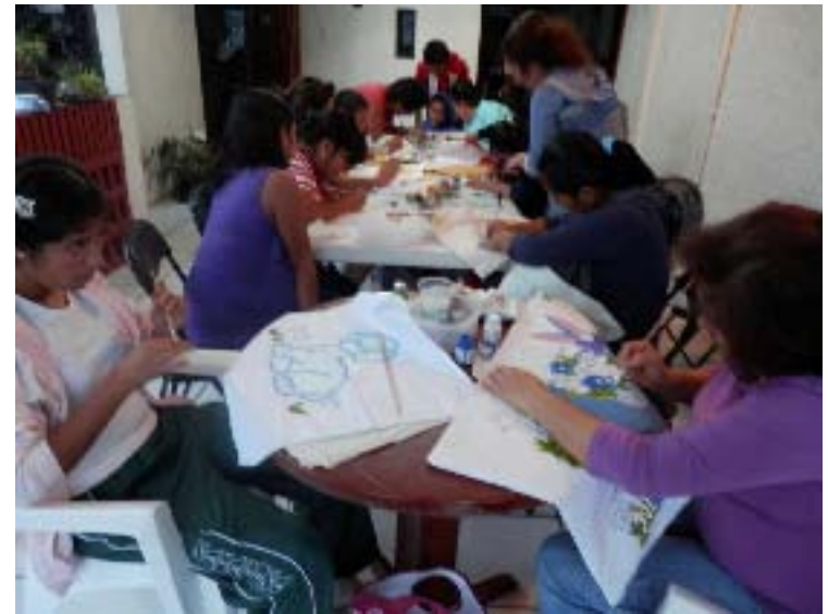
En la casa de Gestión se impartió el Curso de Pintura en Tela, abierto a toda la gente de la comunidad y sin consto alguno.