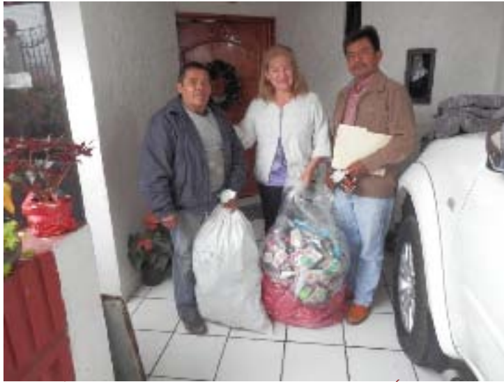
Donación de 100 juguetes para la comunidad de El Álamo, Tlaxco, así como apoyo para la compra de una tonelada de cemento para la Esc. Prim. de la comunidad, y 100 juguetes más para Escuelas de CONAFE en el Municipio de Tlacuilopec.