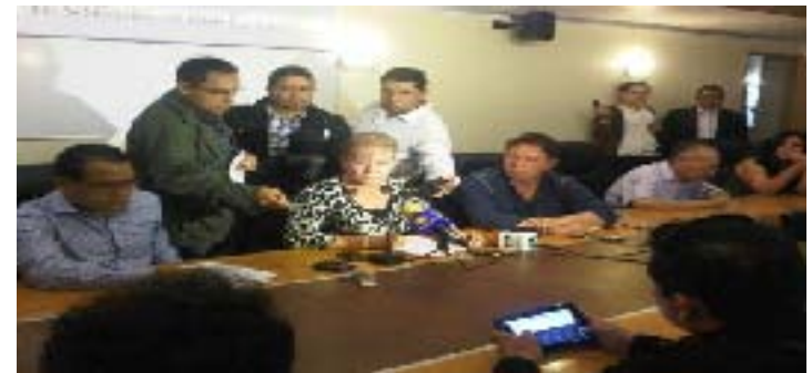
Rueda de prensa de la Comisión Especial Electoral