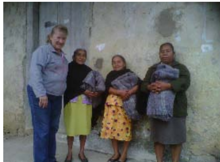
Se entregaron cobijas a personas de las comunidades más alejadas y vulnerables de la Región, por las altas temperaturas.