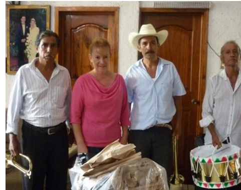
Entrega de equipo para banda de guerra