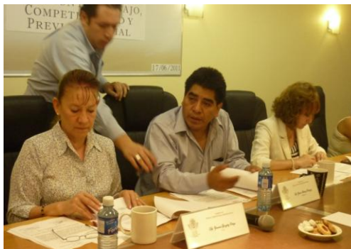
Reunión con la comisión de trabajo, competitividad y previsión social