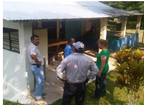
Gira de Trabajo en Jalpan y Pantepec