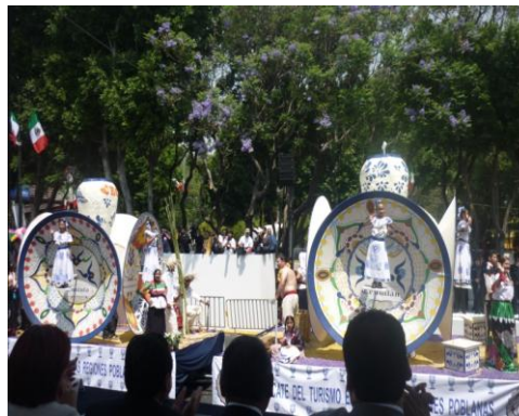
Desfile Conmemorativo del 5 de Mayo