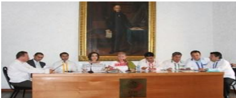
Sesión de la Comisión Permanente y entrega de obsequio a los Diputados integrantes de la Mesa Directiva; camis y blusas con bordados de Mujeres Indígenas del Municipio de Pantepec