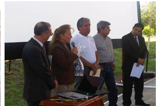
V Encuentro de Innovaciones Tecnológicas en la UTXJ