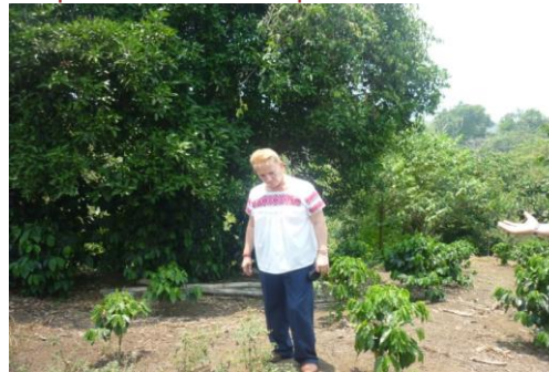
Visita a Fincas en Zihuatehutla, para ver la plantación de arboles ACATROFA que se utilizaran en el proyecto de producción de Biodiesel.