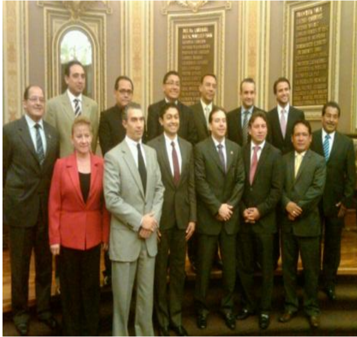
Firma del convenio de colaboración con la Escuela Libre de Derecho de Puebla