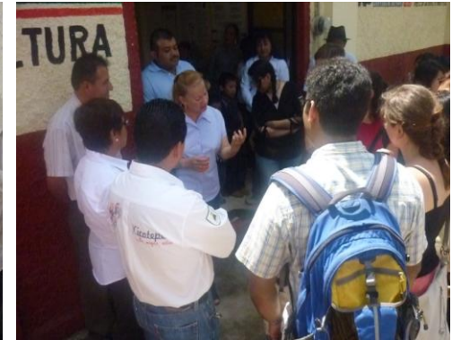
Clausura Del Curso De Verano De La Biblioteca De Xicotepec