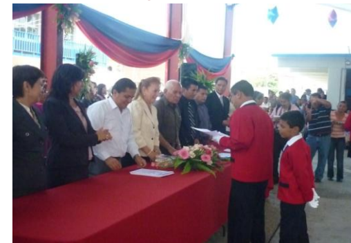
Madrina de Generación de la Escuela J.N. Esquitin