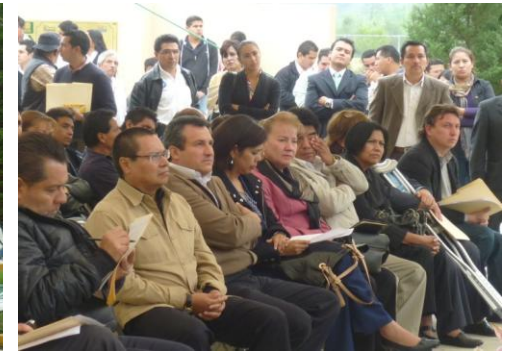
Primer Foro Ciudadano para integrar al agenda legislativa, realizado en Teziutlán