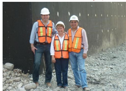
Recorrido por Autopista México – Tuxpan.