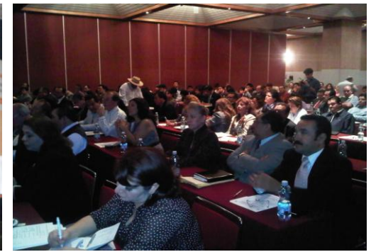
Encuentro Con Legisladores Y Ex legisladores A Favor De La Primera Infancia Celebrado en el D.F..