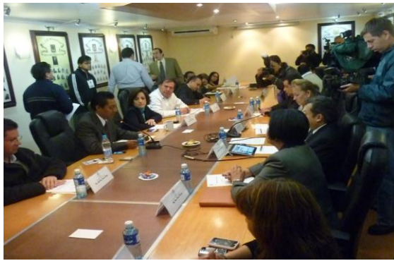
Comparecencia de los Candidatos a Presidentes de la Comisión de Derechos Humanos del Estado de Puebla