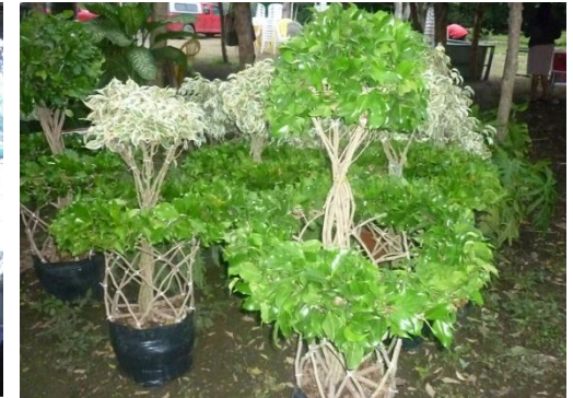
Reunión de Trabajo con la Asociación del OVIPLANT en la Región de la UNO