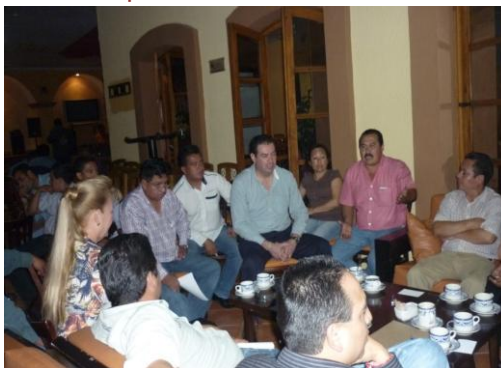
Reunión de Trabajo Con Diputados Locales, Diputados Federales y Presidentes Municipales del Dto. 26° de Xicotepec