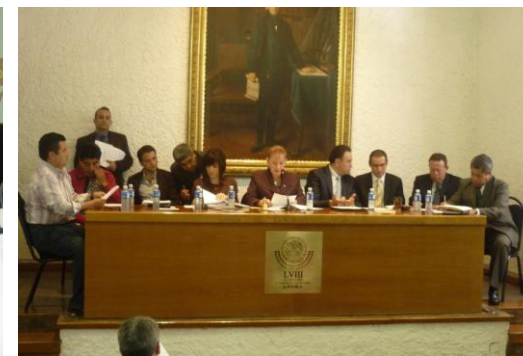
Segunda Sesión de la Comisión Permanente