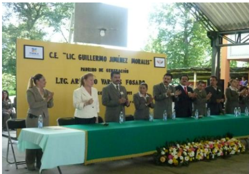
Entrega de reconocimientos a los alumnos del Centro Escolar Lic. Guillermo Jiménez Morales de Pantepec, Puebla.