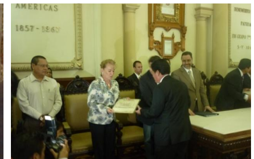
Intercambio Legislativo entre Puebla-Tlaxcala, Pluralidad que Construye.