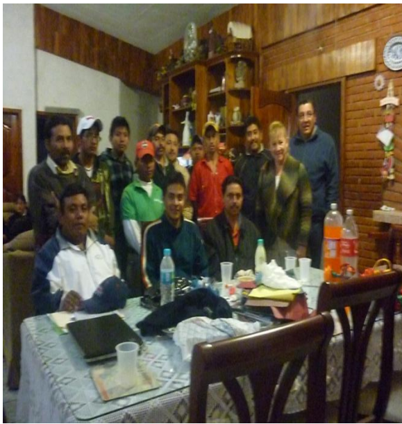
Apoyo a la peregrinación de ciclistas de la Virgen de Guadalupe que desde hace 20 años asisten a la Basílica