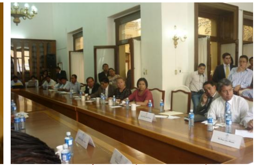
Reunión con el Secretario de Seguridad Publica en el Salón de Protocolos del H. Congreso del Estado