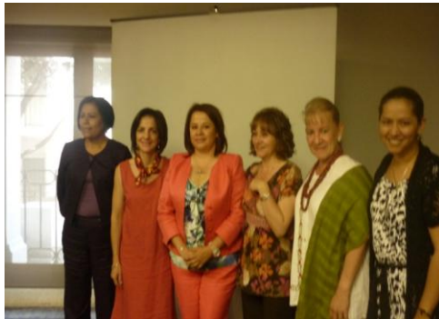
Reunión en el Hotel Presidente Intercontinental con la Delegada de Comisión de Desarrollo de los Pueblos Indígenas y Diputadas de la LVIII Legislatura, trabajos en apoyo a las mujeres de los diferentes distrito.