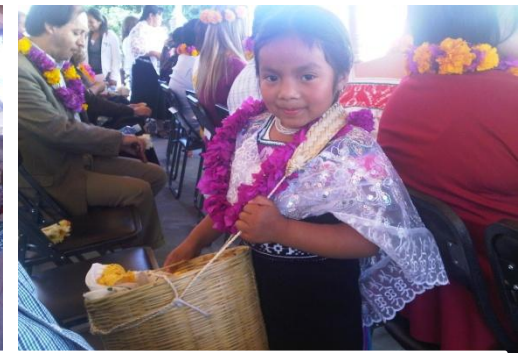
FESTEJO DEL FESTIVAL DE LAS ETNIAS EN ZACATLÁN