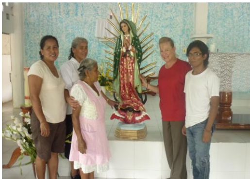
Entrega de la Virgen de Guadalupe a la Capilla de la comunidad “el Tepetate”, perteneciente al municipio de Xicotepec.