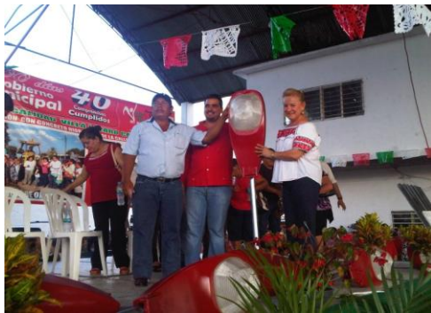
Entrega De Apoyo En Venustiano Carranza