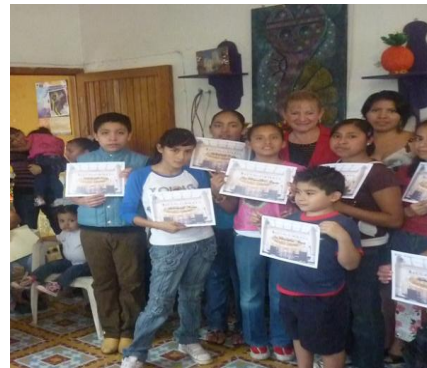
Entrega de Reconocimientos por Clausura del Curso de Verano impartido en la Casa de Gestión