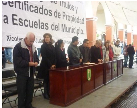
Entrega de Certificados e Propiedad a las Escuelas del Municipio de Xicotepec de Juárez.