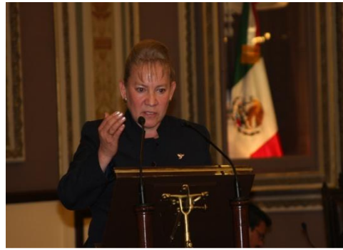
Cierre del Tercer Periodo Legislativo