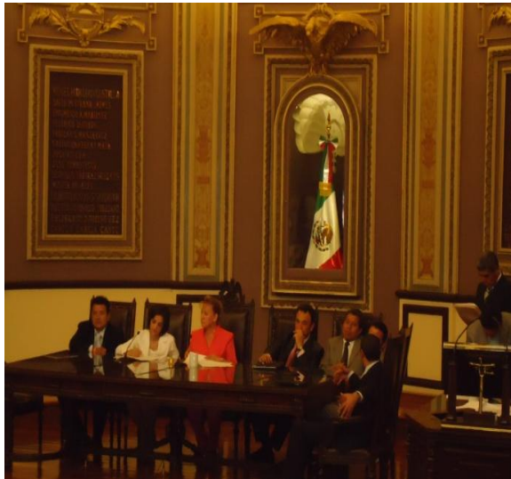
Ultima Sesión de la Comisión Permanente, donde se eligió a la nueva Mesa Directiva que presidirá los trabajos legislativos del Segundo Periodo Ordinario de Sesiones