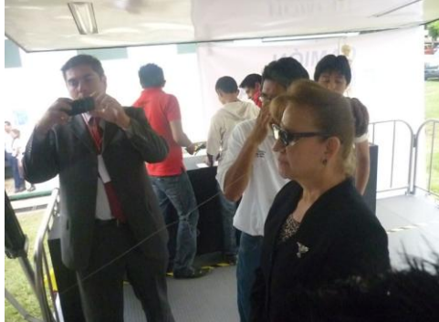
Primer Congreso De Ciencia, Tecnología Y Sustentabilidad Ingenia Tex 2011 En La Universidad Tecnológica De Xicotepec