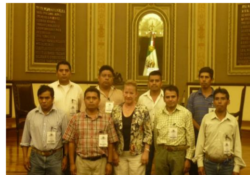
Inicio del Segundo Periodo Ordinario de Sesiones.