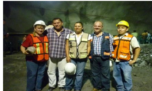
Unión del túnel en I Autopista México - Tauxpán