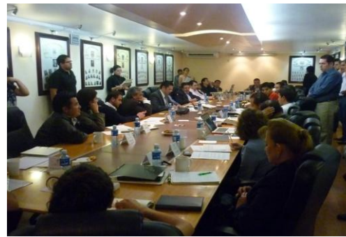
Comisiones Unidas: Comisión Del Trabajo, Previsión Social Y Competitividad, Así Como La Comisión De Educación, Cultura Y Deporte.