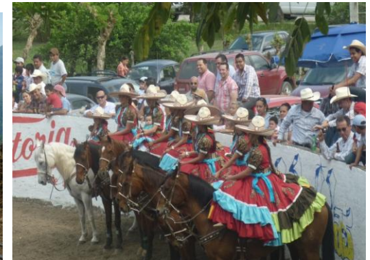
Cabalgata Amelucan - Mecapalapa, Municipio de Pantepec.