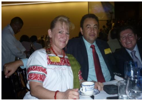
Expo CANITEC, comida con el Presidente de la Republica y Firma de Acuerdo para la Reforma del Programa Nacional de Carrera Magisterial SNTTE