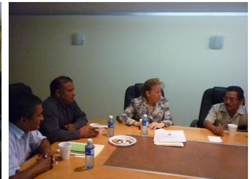
Reunión De Trabajo Con El Presidente Municipal De Jalpan.