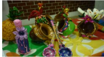
Artesanías elaboradas en la Casa de Gestión, a través de la Técnica "PACHE" a base de papel de china