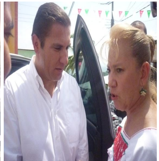
VISITA DEL GOBERNADOR RAFAEL MORENO VALLE ROSAS, EL SECRETARIO DE EDUCACION PÚBLICA Y LA SECRETARIA DE SUSTENTABILIDAD TERRITORIAL EN EL MUNICIPIO DE PANATEPEC, OTORGANDO APOYOS ECONÓMICOS A CAMPESINOS.