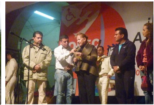
Entrega de apoyo económico al COLECTON de Xicoteppec