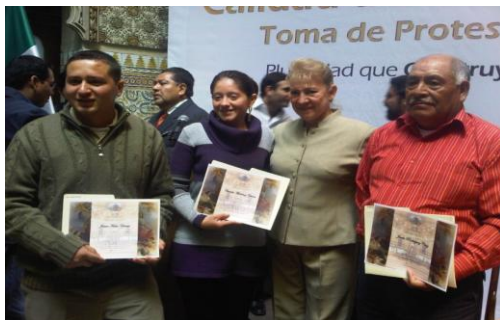
Ceremonia De La Toma De Protesta De Calidad De Poblano