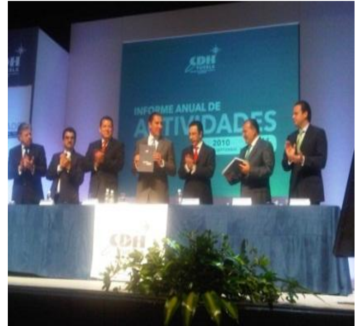
Primer Informe de Actividades del Presidente de la Comisión de Derechos Humanos del Estado