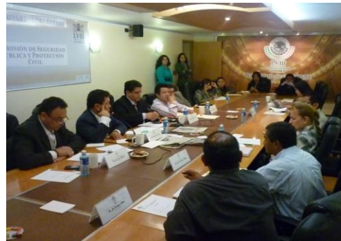
Asistencia a la Comisión de Seguridad Pública y Protección Civil