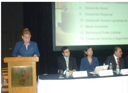
Presentación de la Agenda Legislativa, Pluralidad que Construye