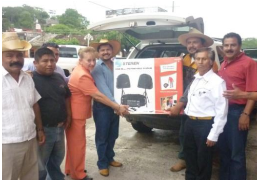
Madrina de Generación y Entrega de Equipo de Sonido