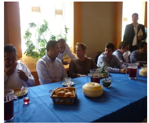
Inauguración del Seminario de Inducción para Autoridades Municipales, Metepec, Atlixco.