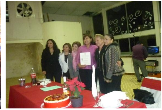
Reconocimiento a las Mujeres del Distrito en una cena de Fin de año