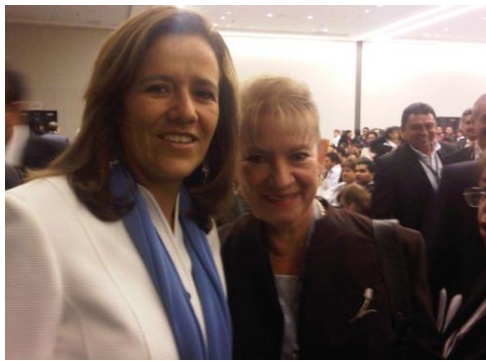
Visita De La Presidenta Del Dif Nacional, La Sra. Margarita Zavala Con Motivo Del Tercer Congreso Internacional De Familia.