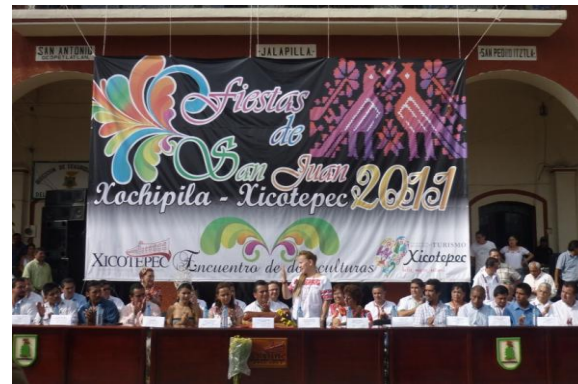
Festejo de la Xochipila, Xicotepec, Puebla.