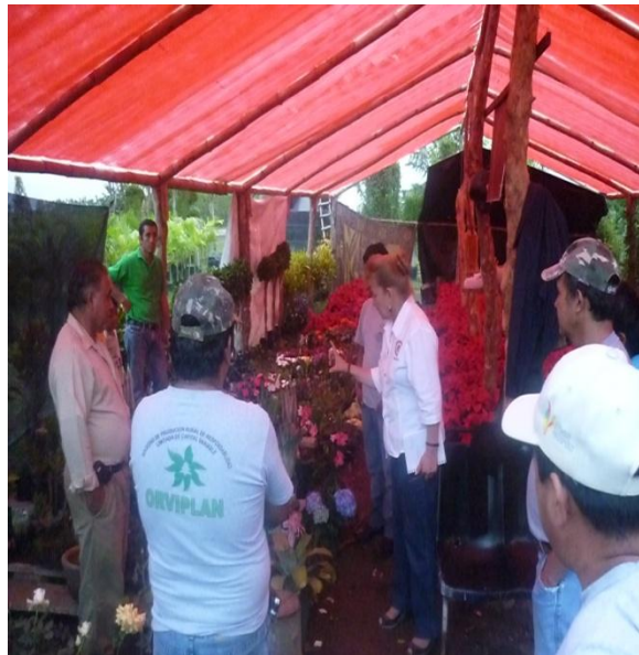
Entrega de apoyo económico a dueños de invernaderos de la comunidad de la Uno