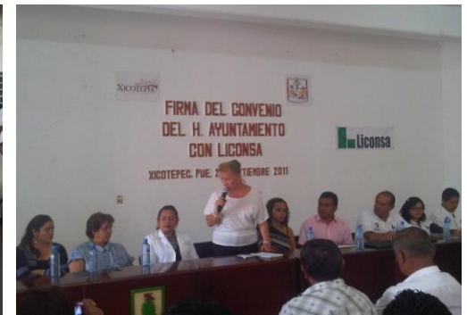
Firma de Convenio del Ayuntamiento de Xicotepec con LICONSA