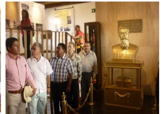
Guardia de Honor en el museo Casa del Gral. Venustiano Carranza en Xicotepec de Juárez