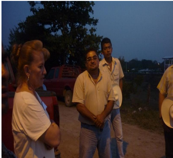
Reunión con la Nueva Asociación de Charros de Francisco Z. Mena.