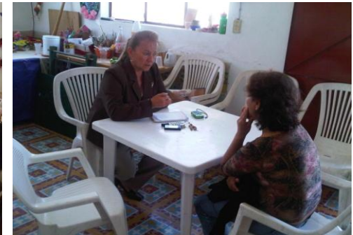
Audiencias en la casa de gestión durante el mes de septiembre