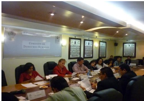
Reunión De La Comisión De Derechos Humanos