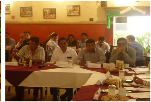
Reunión Con El Secretario De Seguridad Pública Del Estado Y Con Los Presidentes Municipales Del Distrito 26° Xicotepec.