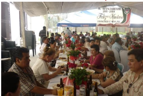
Festejo del día del Maestro en Francisco Z. Mena.