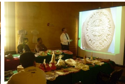
Visita a la Secretaria de Cultura, donde el Presidente Municipal de Francisco Z. Mena presento proyectos para impulsar el turismo en su municipio, así como también hizo una demostración de todos los productos elaborados en su región.