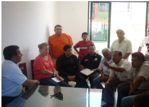
Reunión de Trabajo con Concesionarios de diferentes rutas en Xicotepec