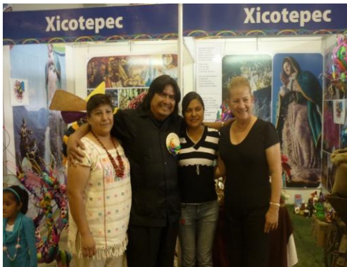
Exposición de trabajo de Artesanos de Xicoteppec, en la feria de Mayo en el Centro Expositor de Puebla