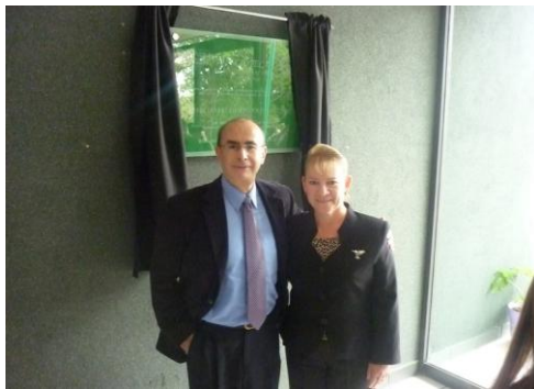
Develación De La Placa En La Biblioteca De La UTEXJ Que Lleva El Nombre Del Primer Astronauta Mexicano, Dr. Rodolfo Neri Vela