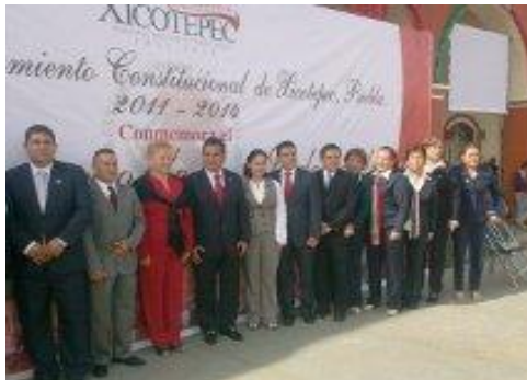
Guardia de Honor en el H. Congreso del Estado – Septiembre Mes de la Patria