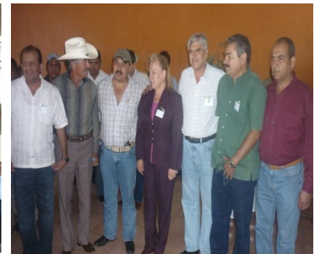
Nombramiento de Zacatlán como Pueblo Mágico