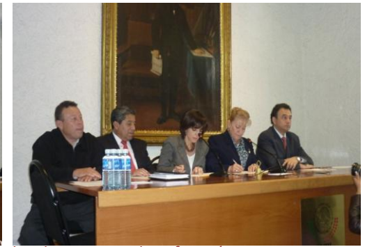
Instalación de la Comisión Permanente, del Primer año del Ejercicio Legal, donde una servidora fungió como Presidenta de la Mesa Directiva