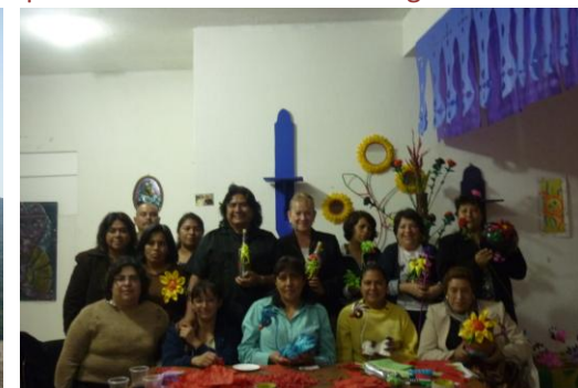
Ayorando en el trabajo al Grupo de Artesanos de Xicotepec.