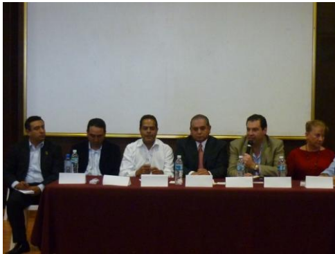
Reunión con el Secretario de Seguridad Publica, Diputados Locales del distrito 25 y 26, el Diputado Federal con cabecera en Huauchinango Ing. Ricardo Urzúa Rivera , y presidentes municipales de la Sierra Norte, donde se trato el tema de la seguridad, el equipamiento y capacitación de los miembros del cuerpo policial de los ayuntamientos