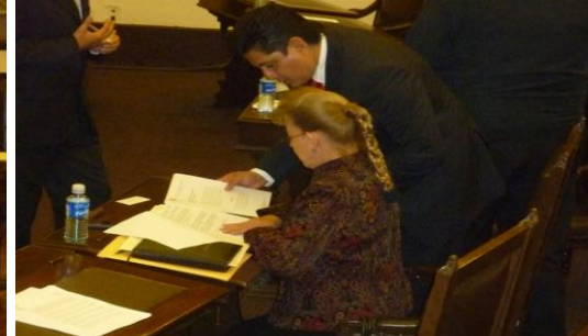
Sesión Ordinaria Del Día Viernes 30 De Junio.