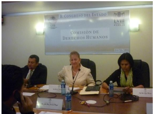
Reunión de trabajo de la Comisión de DH