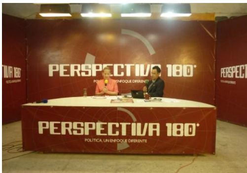
Entrevista otorgada al noticiero Perspectiva 180 ° de Telexico