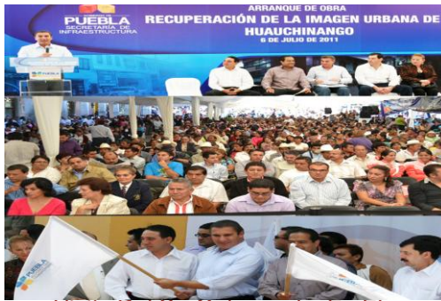
Visita Del Sr. Gobernador En El Arranque De Obra De Recuperación De La Imagen Urbana De Huauchinango.