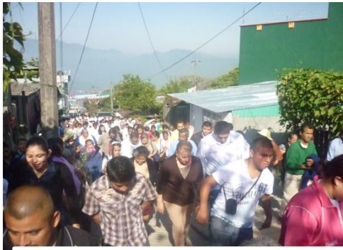
Inauguración de la estatua más grande en América Latina de la Virgen de Guadalupe, ubicada en el Municipio de Xicoteppec