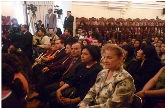
Foro Libres E Iguales: de la Conquista al Voto A ser Electas