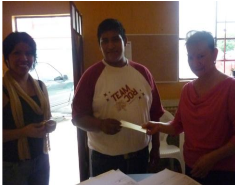
Apoyo económico a equipo de futbol