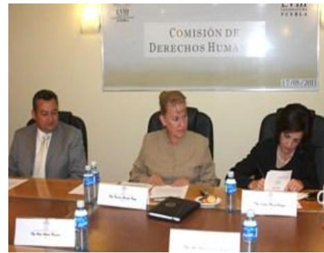
En Comisión de Derechos Humanos se solicitó al Secretario General de Gobierno tomar acciones pertinentes de vigilancia en las diferentes demarcaciones, a fin de que no se registren hechos violentos.