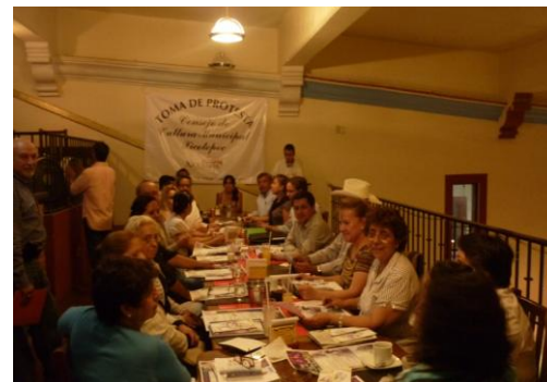
Reunión para la organización de los festejos de la Xochipila en Xicotepec, Puebla.