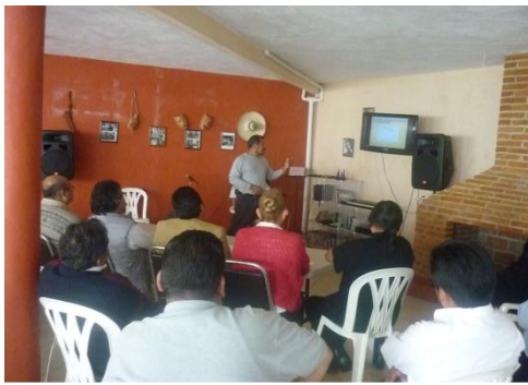
Visita de Directivos de la BUAP a Xicoteppec, para estudiar la región y considerar la creación de un nuevo Campus