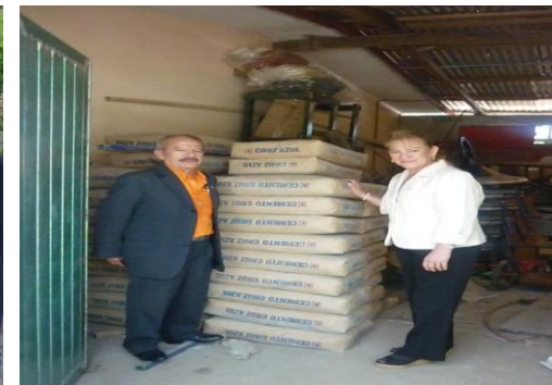
Entrega de cemento