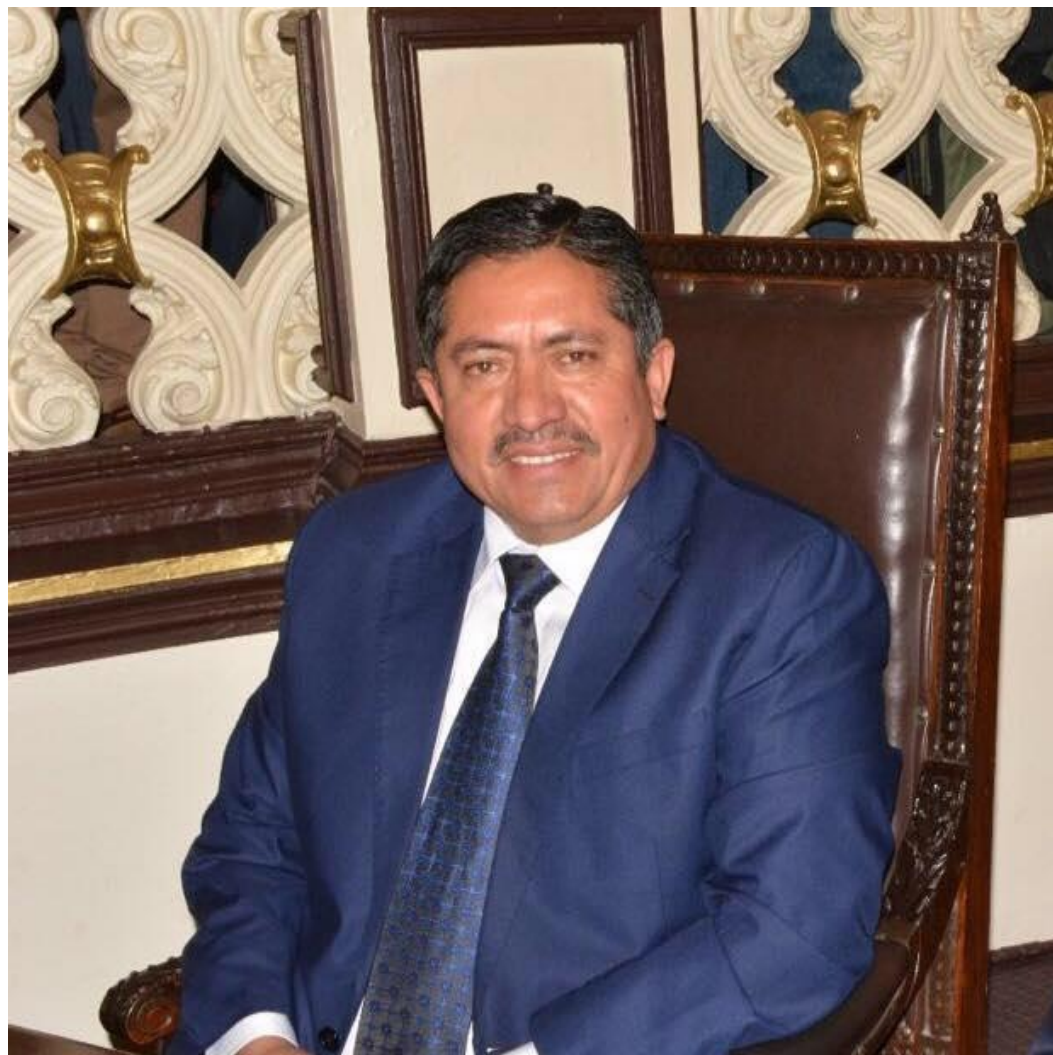
Diputado Víctor León Castañeda

4 años de trabajo, años de resultados a la vista