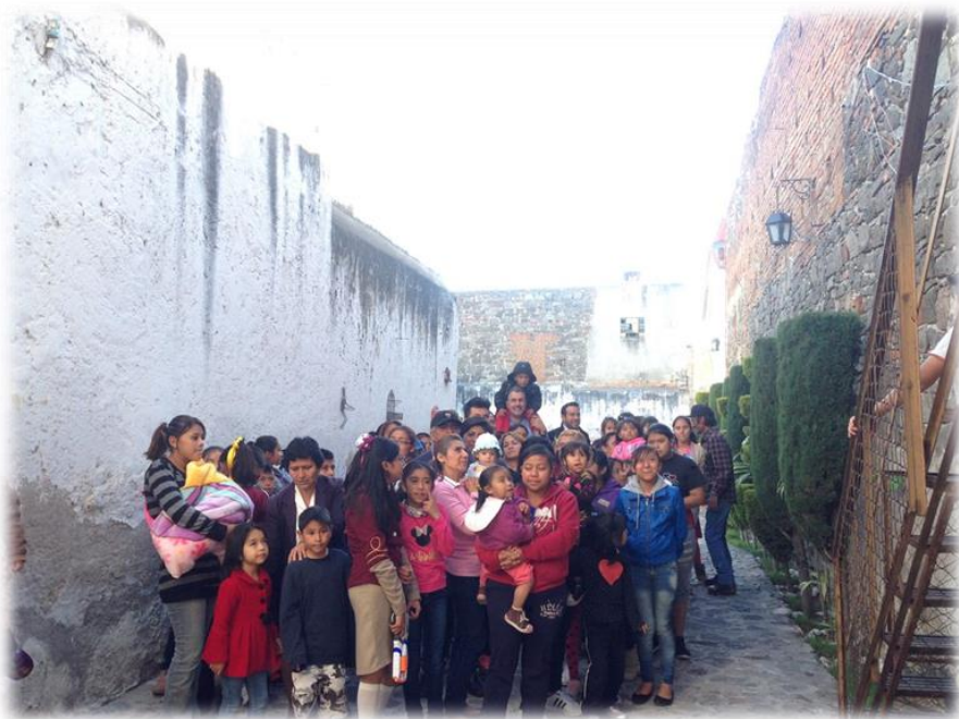
Visita al Distrito con motivo del Día de Reyes Enero 9