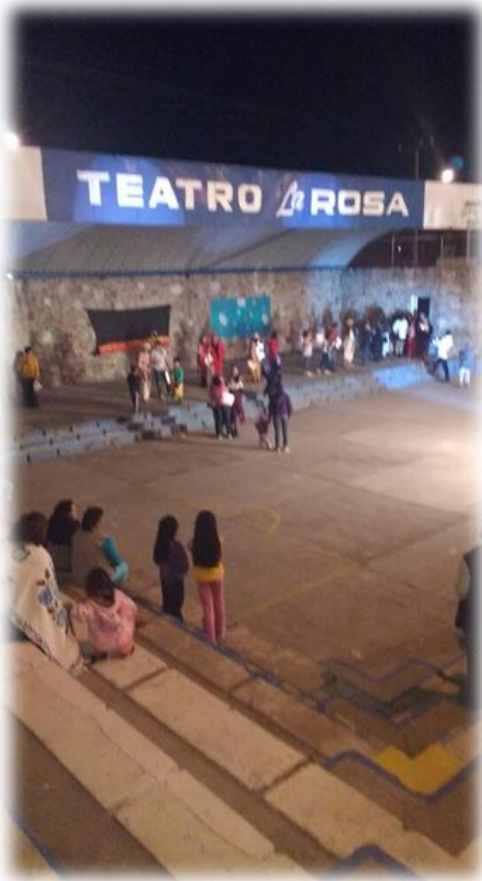
Posada Decembrina U.H. La Rosa Diciembre de 2016