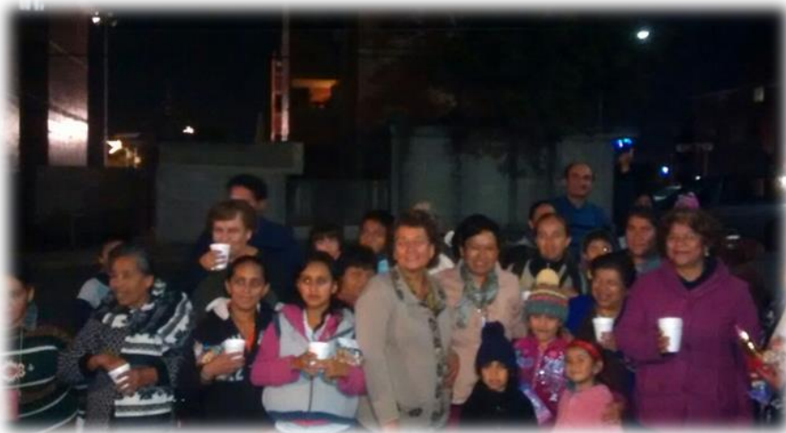
Posada Decembrina Infonavit San Jorge Diciembre de 2016