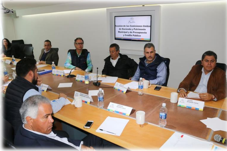
Comisión de Hacienda y Patrimonio Municipal Enero 3