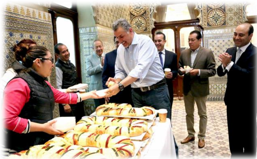
Rosca de Reyes del Congreso del Estado Enero 6