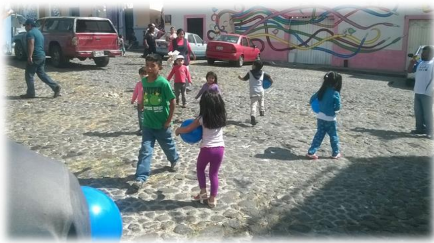
Día de Reyes Barrio de Xanenetla Enero de 2017