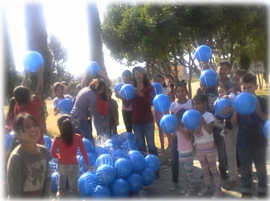
Día de Reyes Santa Cruz los Ángeles Enero de 2017