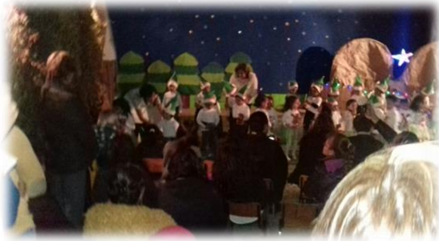
Posada Decembrina Barrio El Carmen Diciembre de 2016