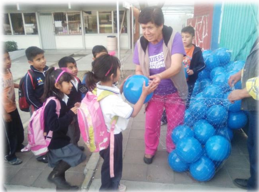
Día de Reyes Colonia 10 de Mayo Enero de 2017