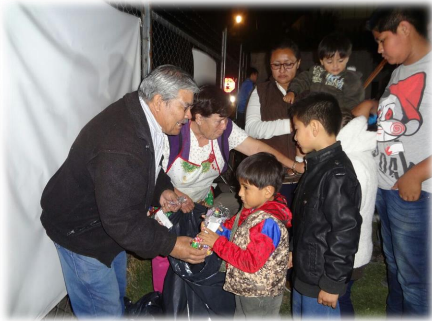
Posada Decembrina Colonia 10 de Mayo Diciembre de 2016