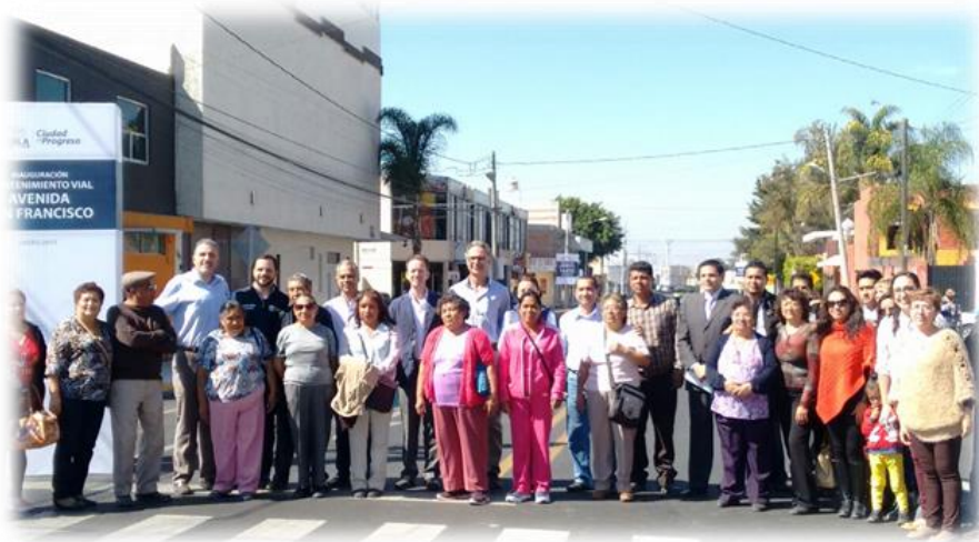
Mantenimiento Vial Avenida San Francisco Enero 2