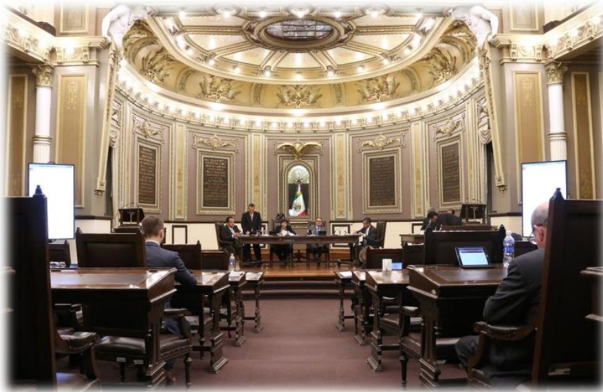
Sesión Extraordinaria del Pleno Enero 6