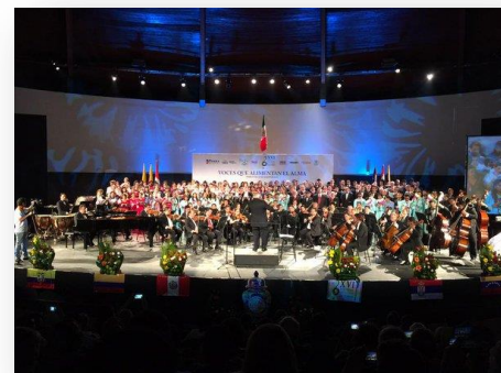
Festival Mundial de coros, organizado por el Coro Normalista del Estado de Puebla.