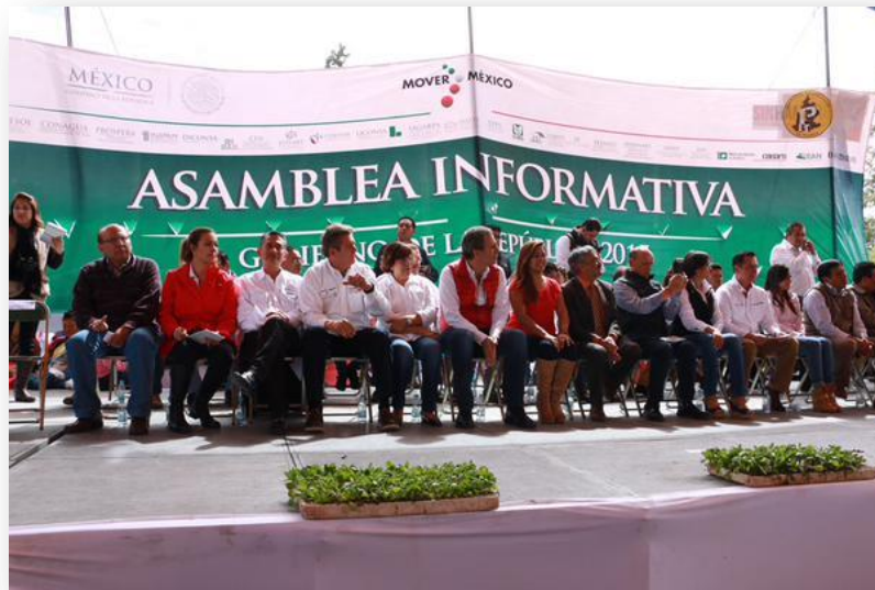
Asamblea Informativa Delegaciones del Gobierno Federal.