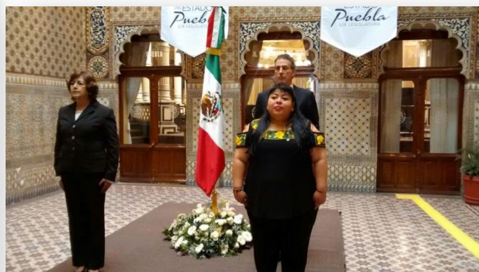
Honores al Lábaro Patrio, 24 de Febrero