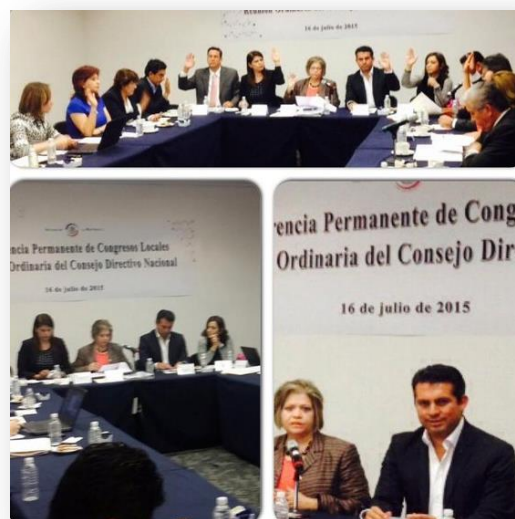
Reunión Ordinaria del Consejo Directivo Nacional COPECOL.