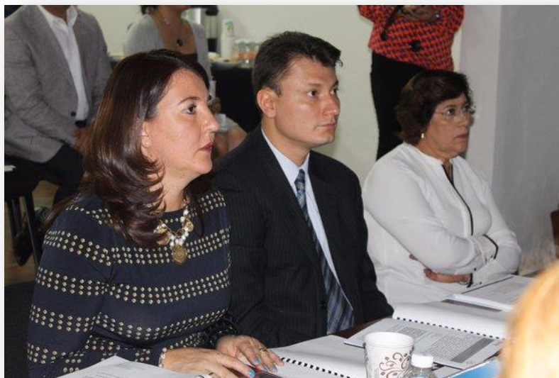
Reunión Junta de Gobierno Instituto Poblano de la Mujer