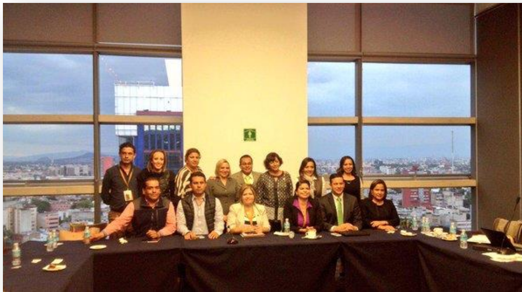
Reunión comité organizador de la Séptima Asamblea Plenaria de la COPECOL.