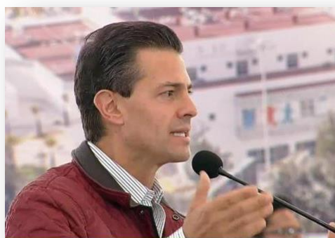
Inauguración Hospital del Niño Poblano por parte del Presidente de los Estados Unidos Mexicanos