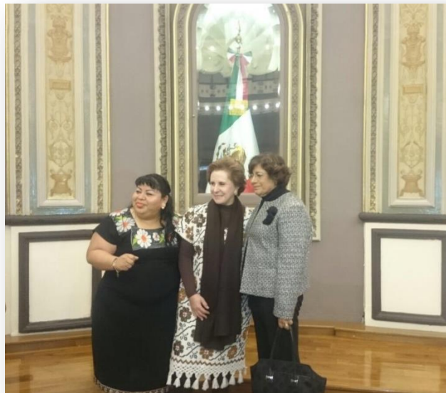
Visita en el Congreso del Estado de la Cónsul de México en Nueva York, Sandra Fuentes-Berain Villenave.