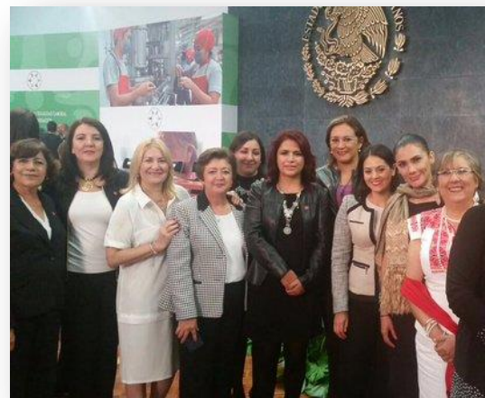
Presentación de la Norma Mexicana en Igualdad Laboral y no discriminación.