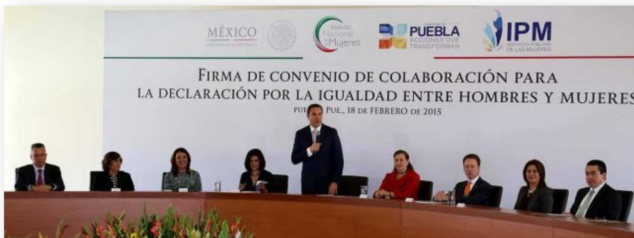
Firma convenio de colaboración para la declaración por la igualdad entre hombres y mujeres, INMUJERES y Gobierno del Estado de Puebla.