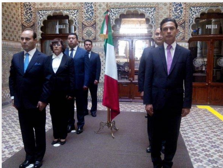
Honores a la Bandera con motivo del 205 aniversario de la Independencia Nacional.