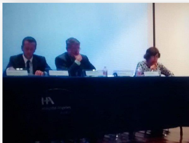
Panel de análisis acerca del tema: Violencia Obstétrica.