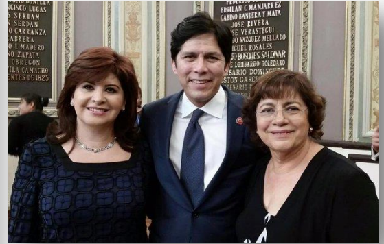
Encuentro con Legisladores del Estado de California, de los Estados Unidos de América