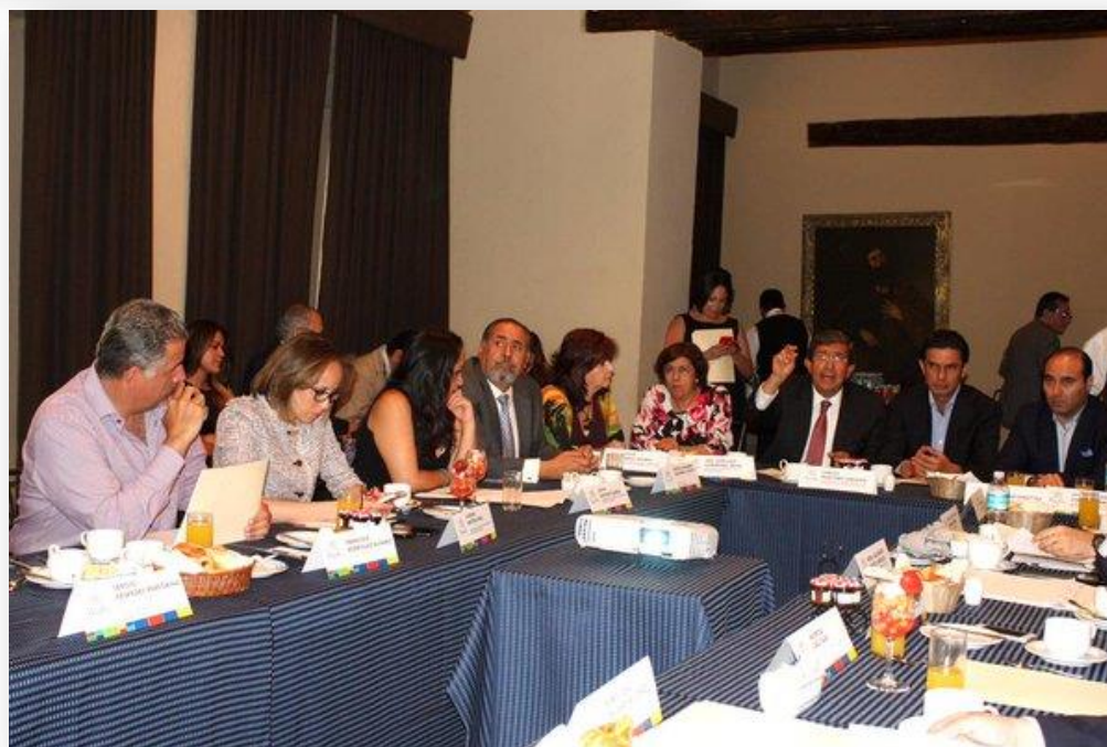
Reunión de trabajo con funcionarios de la Secretaria de Desarrollo Social del Gobierno del Estado de Puebla.