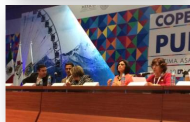
Séptima Asamblea Plenaria COPECOL.