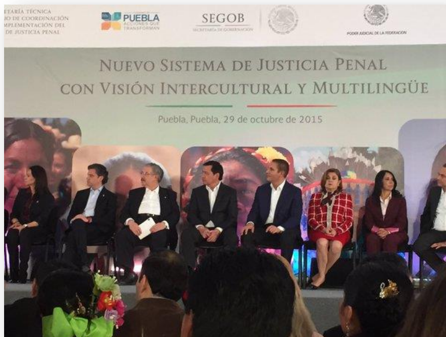
Presentación del nuevo sistema de justicia penal con visión intercultural y multilingüe.