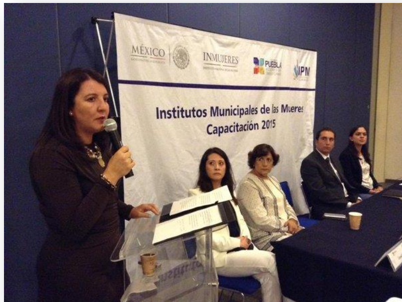
Capacitación 2015 de instancias municipales para mujeres.