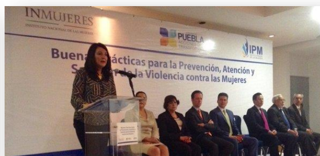
Foro "Buenas Prácticas para la Prevención, Atención y Sanción de la Violencia contra las Mujeres."