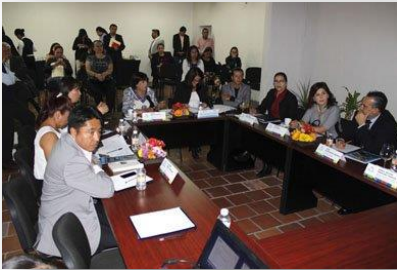
Reunion de Trabajo en el Instituto Poblano de la Mujer para la armonización legislativa.