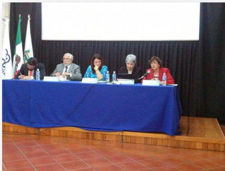
Foro Interinstitucional para el fortalecimiento de la respuesta al feminicidio.