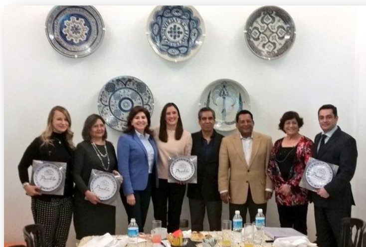
Reunión de evaluación con Funcionarios de la Secretaria de Educación Pública.