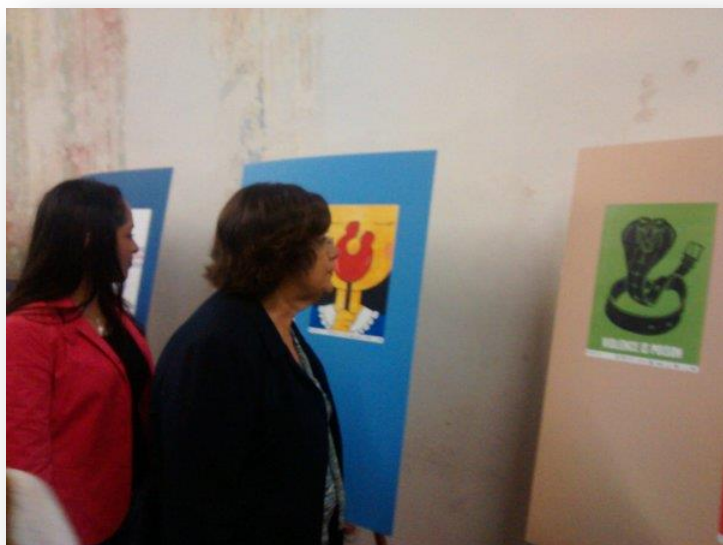
Inauguración de la Exposición "Las huellas de la violencia familiar".