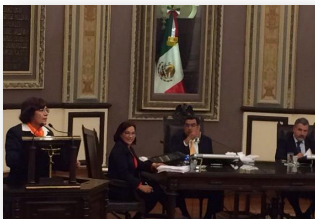
Conmemoración del día 25 de noviembre, para la Eliminación de la Violencia contra las Mujeres.