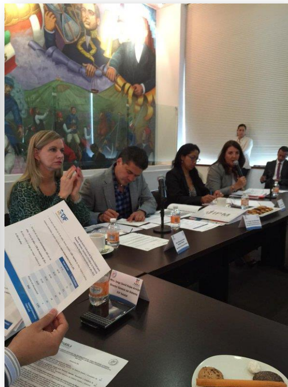
Sesión del Sistema Estatal para prevenir, erradicar y sancionar la violencia.