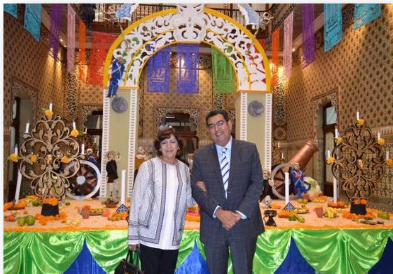
Exposición de ofrendas en la Sede Principal del Congreso y oficinas en el "Mesón del Cristo"