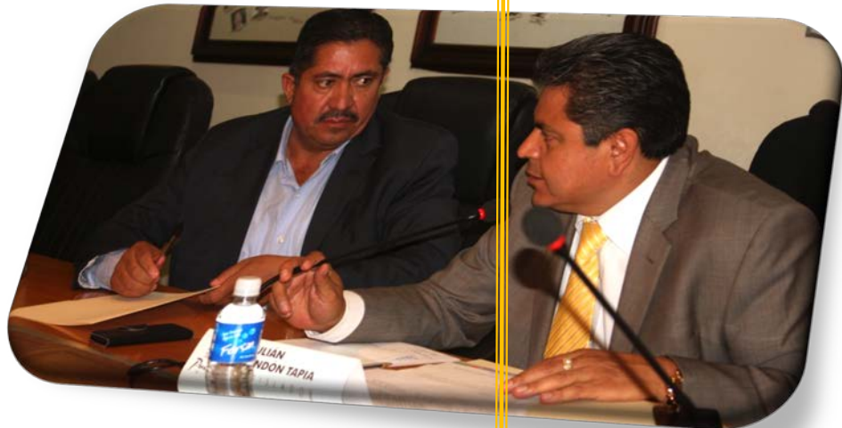
COMISIONES DE GOBERNACION.