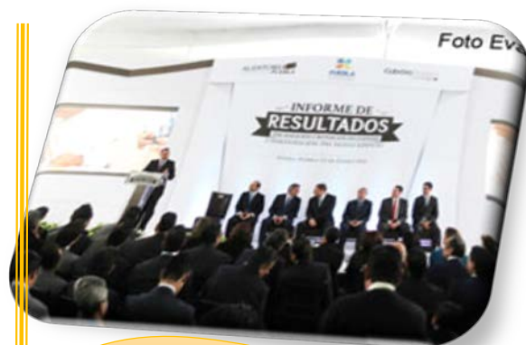
RESULTADOS DE FISCALIZACIÓN Y RENDICION DE CUENTAS 2015.