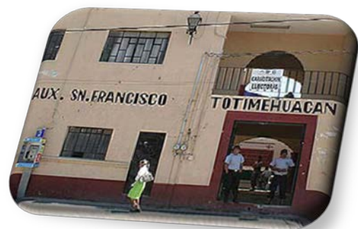
SAN FRANCISCO TOTIMEHUACAN.