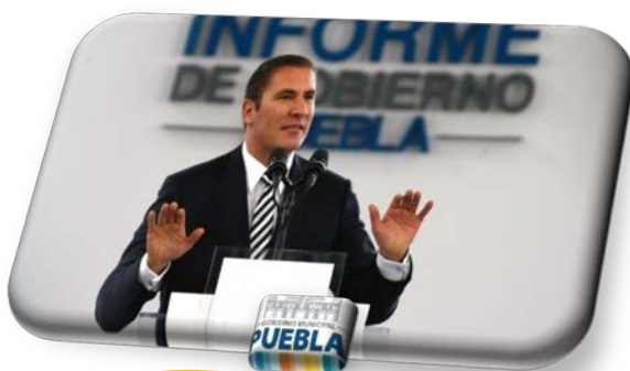
5to INFORME DE GOBIOERNO