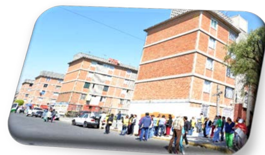
U.H. SAN JORGE.