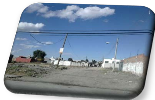
SAN ISIDRO CASTILLOTLA.