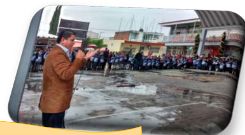
ENTREGA DE KITS ESCOLARES