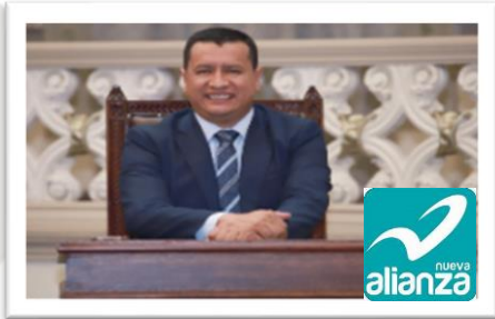
Dip. Elías Lozada Ortega Presidente

HONORABLE CONGRESO DEL ESTADO DE PUEBLA LXII LEGISLATURA Inclusión, Diálogo y Consenso